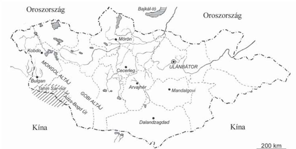
2. kép. Mongólia térképe a Przewalski-ló 1970-ben feltételezett elterjedési területével (sávozással jelölt terület)