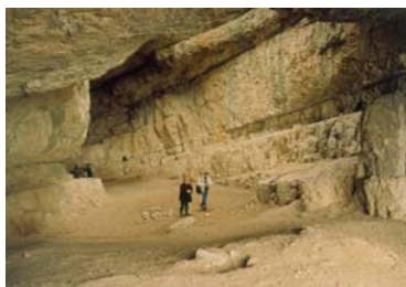
A Szelim-barlang óriási terme