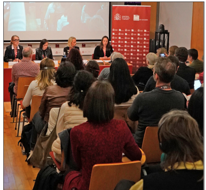
1. kép: A konferencia az altamirai múzeumban

A konferencia középpontjában az illegális műtárgy-kereskedelem és a régészeti lelőhelyek pusztítása állt, ám már az első előadások világossá tették, hogy a probléma jóval túlmutat a klasszikus „bűnügyi” kereteken. A kérdés nem csupán az, hogyan lehet megakadályozni a fosztogatást, de az is, hogy a meglévő jogi, intézményi és társadalmi rendszerek mennyiben alkalmasak e jelenségek értelmezésére és kezelésére.