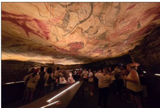
2. kép: Az altamirai barlang valóság-hű másolata a lelőhely mellett kiépített múzeumban

A konferencia egyik visszatérő motívuma a jogi szabályozás kettőssége volt: a nemzetközi szabályozás érdemi jogi háttérrel nyújt – ennek része az UNESCO 1970. évi egyezménye a kulturális javak illegális exportjáról és importjáról, az Európa Tanács 1992. évi máltai egyezménye a régészeti örökség védelméről, a 2005. évi faroi egyezménye a kulturális örökség társadalmi értékéről és a 2017. évi nicosiai egyezménye a műkincsek tiltott kereskedelméről, továbbá két EU-rendelet (a 116/2009/EK