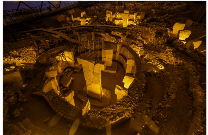
1. kép: Göbekli Tepe, „C” épület

Immáron több mint 30 éve folyamatosan érkeznek a hírek és a kutatási beszámolók a Törökország délkeleti részén fekvő Göbekli Tepén, a tőle 60 km-re délre lévő Karahan Tepén és további 13 újkőkori településen folyó ásatásokról, valamint az ott talált egyedülálló kultúra maradványairól. Az utóbbi években ezek a tudósítások megszorodtak és egyre nagyobb nyilvánosságot kaptak, azonban az ott talált leletekből eddig csak elvétve lehetett néhány darabot látni Európa múzeumaiban. Ezért különösen fontos és érdekes a február elején a berlini Múzeumszigeten lévő James Simon Galériában megnyílt, „Göbeklitepe, Taş Tepeler und das Leben vor 12.000 Jahren” című régészeti kiállítás, amely átfogó képet ad az egyik első letelepedett társadalom mindennapjairól, építészetéről, művészetéről és hitvilágáról (1. kép).