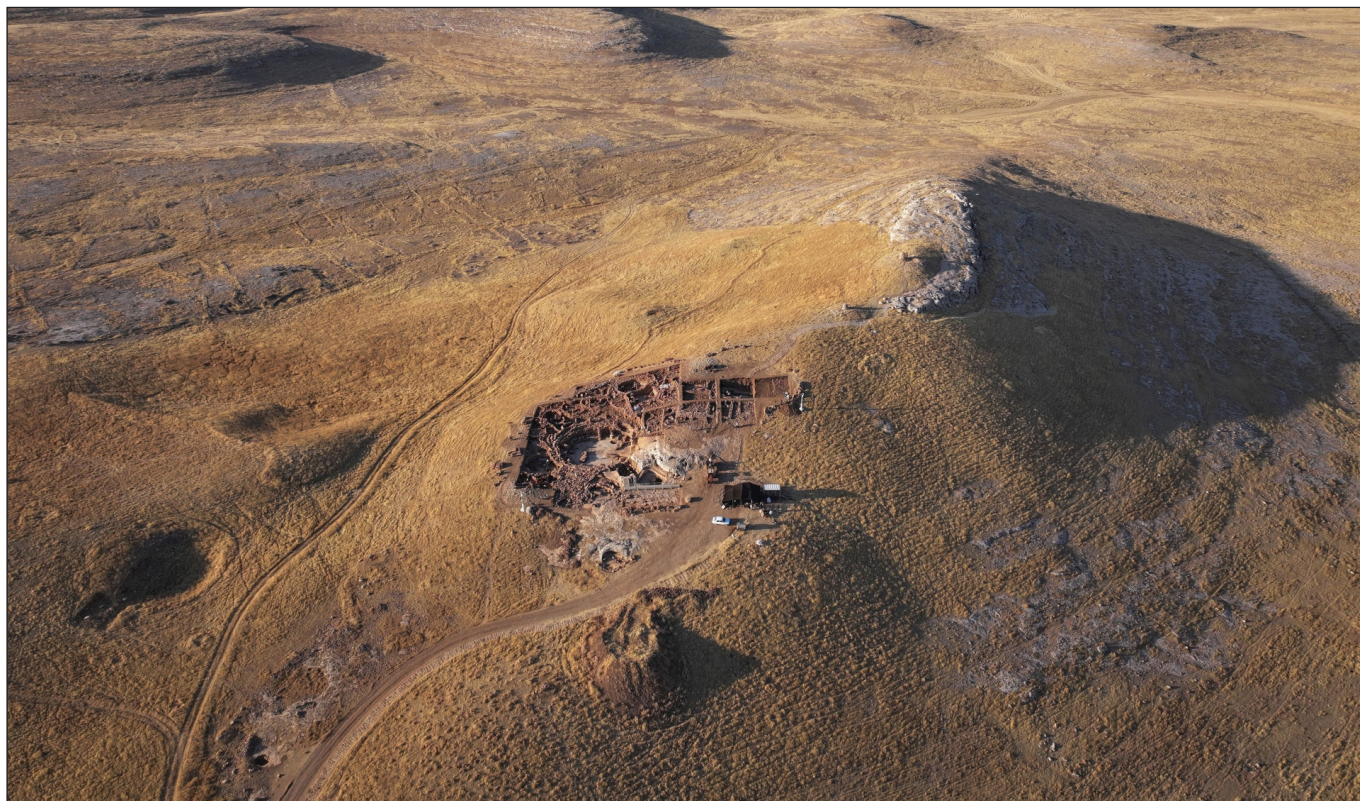
6. kép: Ásatás Karahán Tepén, légifelvétel

A berlini kiállítás 2026. július 19-ig tekinthető meg.