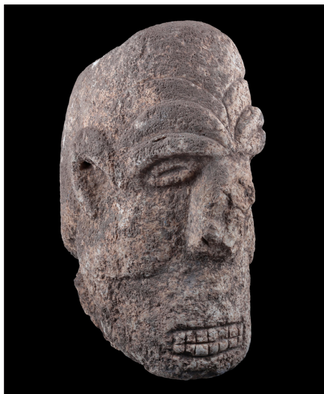
4. kép: Emberfej Karahanteperől, i. e. 9400–8000

Az első letelepedett közösségek még vadászból éltek. Az állatok befogása és elejtése nemcsak fegyverrel, hanem az ún. sivatagi sárkánnyal is történt: a vándorló állatcsordákat (például gazellákat és vadszamarakat) a hajtók kőfalak közé terelték. Az állatok a falak mentén egyre beljebb menekültek, míg végül beszorultak a tölcser végén lévő félkör alakú zárt részbe, ahol könnyű prédává váltak. A hajtók és a vadászok összehangoltan dolgoztak együtt. Ennek a módszernek az volt az előnye, hogy az állatok legfeljebb megsérültek, de nem pusztultak el. Így ki tudták közülük választani, hogy melyik példányt ölik meg, melyik húsát használják fel. A csapdák mellett – amik légifelvételről a mai napig jól láthatók – tűzkőből és obszidiánból készült pattintott szerszámokat találtak, amelyeket az egykori vadászok az állatok leölésénél és feldolgozásánál használtak. Egy idő után már annyira tökéletesítették ezt a módszert, hogy az állatokat