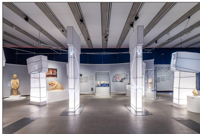
3. kép: A kiállítás központi terme a T-alakú pillérekkel és a vetített faragványokkal

Az első termet elhagyva színpadképszerű látvány tárul a látogatók elé. Fehér oszlopokra, illetve az ásásokon előkerült T-alakú pillérek másaira vetítve láthatók a hozzájuk tartozó faragványok. Ezen oszlopok közé állították fel a vitrineket, monitorokat és installációkat, amelyek részletes felvilágosítást adnak ennek a kőkorszaki társadalomnak a mindennapjairól. Bár az eredeti oszlopokhoz képest ezek a fehér másolatok „sterilnek” tűnnek, ez a megoldás a térérzékelés szempontjából mégis érdekes (3. kép).