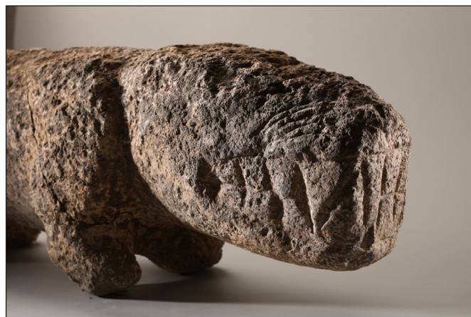
5. kép: Leopárdszobor Karahan Tepéből (© Şanlıurfa Museum, Yusuf Aslan)

A neolitikum képi világában az állatoknak központi szerep jutott. A vadászat és befogás közben az emberek nagyon pontosan megfigyelték az állatok karakterét, és közülük a művészi vénával rendelkezők a legapróbb részletességgel alkottak a róluk – általában mészkőből faragott – képmásokat. Különösen a veszélyes állatok ihlették meg a művészeket: a leopárdot vicсорító fogakkal (5. kép), az őstulkot lehajtott, támadásra kész fejjel, a vaddisznót zabolátlan ügetés közben örökítették meg. Érdekes módon ezek mind hímnemű, agresszív példányok, helyenként színes festékekkel színezve. Az ábrázolások közül például hiányzik a gazella, ami pedig az egyik leggyakoribb levadászott állatfaj volt. Tehát nem elsősorban az akkori fauna, hanem a veszélyekkel teli világ leképezése volt a cél. Vannak olyan szobrok is, amelyek együtt ábrázolnak állatokat és embereket; ilyen például az emberi alak hátán kúszó leopárd. Ezeknek a szobroknak a jelentését eddig még nem tudták megfejteni. Nem világos, hogy ez inkább veszélyt vagy inkább valamiféle védelmet hívatott bemutatni.