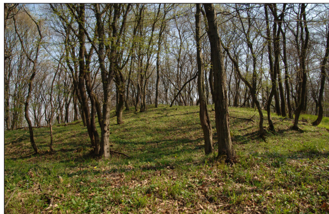
1–2. kép. Képek a kötetből: Galgamácsa-Ecskend erődítésének maradványai napjainkban