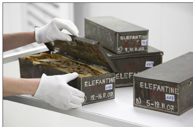
1. kép. Ásatási ládák papírdarabokkal elefánt-szigetről

Ebben az egységben a fűszereké a főszerep; ezeket nem csak üvegcsékben tárolva láthatjuk, illetve olvashatunk róluk, de egy farostlemez megdörzsölése után valóságos illatfelhőben találjuk magunkat, melyben több fűszer illata is felfedezhető.