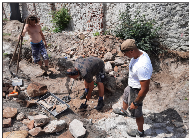
9. kép. Önkéntesek Keszthely-Fenékpusztán