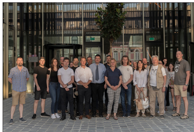
3. kép. Csoportkép a Zala megyei régészeti önkéntesekről – Régészet Napja, Közösségi régészeti találkozó (2022)

léletben szerepel. Amennyiben a keresős új, eddig nem ismert régészeti lelőhelyet, régészeti korú leletet talál, köteles jelezni a kapcsolattartónak. Amennyiben nem csak szórványleletről van szó, hanem a kutatás során valóban új régészeti lelőhely került elő, akkor azt a terepi ellenőrzést, és a lelőhely határainak kijelölését követően a múzeum régészei bejelentik a hatóságoknak.