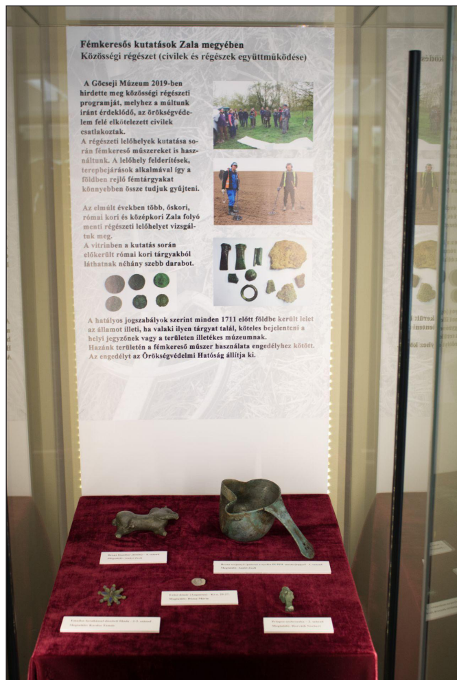
2. kép. Fémkeresős kutatások Zala megyében – kamarakiállítás a zalaegerszegi városházán (2020. október)