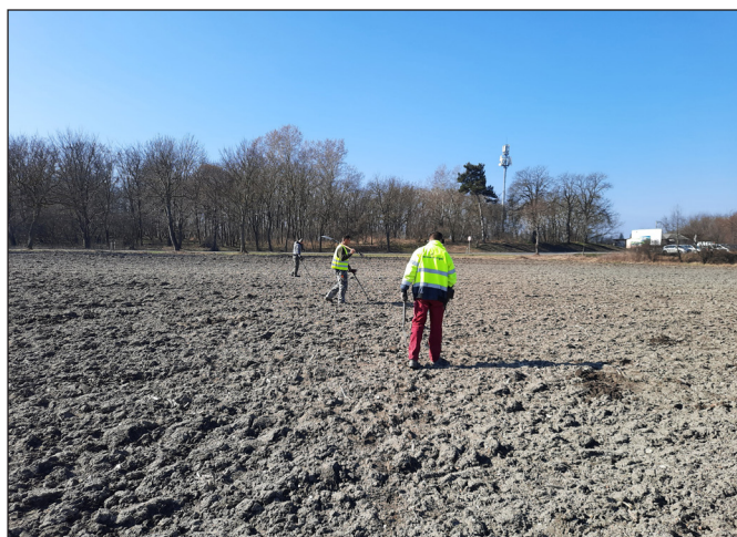
8. kép. Keszthely, Fenékpusztá-Vámház fémkeresős kutatása

A 2019-es év elején toborzónapot tartottunk, bemutatva régészeti projektjeinket és a fémkeresőzésre vonatkozó jogszabályi hátteret. Ez év őszén akadt egyik önkéntes munkatársunk arra a bronzdepóra, amely — már restaurálva — 2021. augusztusában a Balatoni Múzeumban a hónap műtárgya volt. A 92 bronz-