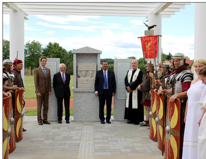
7. kép. A bagodi Római kori Emlékpark avatása, 2022