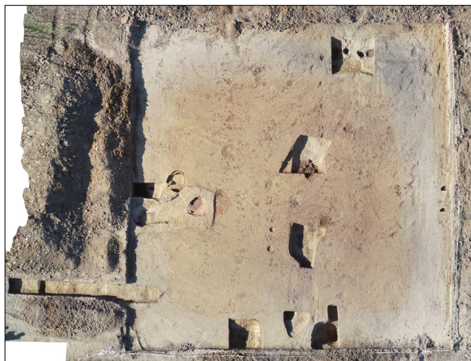
6. kép. A 2020-ban végzett bagodi feltárás ortofotója

A feltárás eredményeiről, illetve a régészeti kutatás utóéletéről 2021. március 4-én a Göcseji Múzeum Múzeumi találkozások ONLINE programsorozatában számoltunk be, Egy római kori sírkő nyomában ,