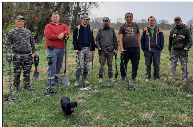
10. kép. A Balatoni Múzeum önkéntes csapata, 2022

Bár a két múzeum közösségi régészeti programja külön-külön került bemutatásra, azok számos ponton kapcsolódnak egymáshoz. Mindenki arra törekszik, hogy a Göcseji Múzeum és a Balatoni Múzeum önkéntesei is részt vehessenek a Zala megyei ásatásokon. De a megyénk határain kívül zajló kutatásokon is jelen vagyunk: több alkalommal lehetőség nyílt rá, hogy a Zala megyei civil kutatók más intézmények által szervezett programokban is részt vegyenek. A Janus Pannonius Múzeum és a Pázmány Péter Katolikus Egyetem által vezetett mohácsi csataterkutatókon is több alkalommal közreműködtünk, emellett önkénteseink a Magyar Nemzeti Múzeum által koordinált Somló-hegyen zajló régészeti programban is részt vesznek, számos lelettel gazdagítva a magyar kulturális örökségünket.