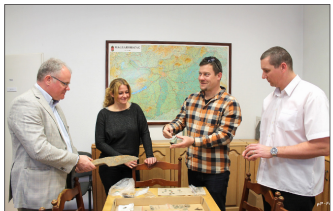
1. kép. Sajtótájékoztató a Göcseji Múzeum és az önkéntes fémkeresősök együttműködéséről (2019. március)

Az együttműködés feltételeinek megalkotásához azoktól az intézményektől kaptunk segítséget, tanácsokat, ahol ezek a programok már korábban elindultak. Természetesnek tűnt, hogy a Ferenczi Múzeumi Centrum és a Közösségi Régészeti Egyesület segítségét kérjük a szabályok megalkotásához, de a kecskeméti Katona József Múzeum és a Baranya megyei kollégák (SZABÓ & SZAJCSÁN 2017) is hasznos tanácsokkal láttak el minket. Így a helyi örökségvédelmi hatósággal egyeztetve ki tudtuk alakítani azt a hatályos jogszabályoknak és a helyi igényeknek is megfelelő szabályrendszert, amely keretet adott a civil fémkeresősökkel történő együttműködéshez.