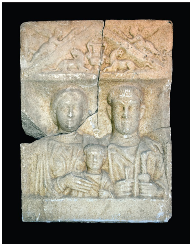
4. kép. A bagodi római kori sírkő

sírkő előkerülési helyén végeztünk el. A Nagy László vezette kutatás során 20.230 m 2 területen magnetométeres felmérést és 917 m 2 területen földradaros mérést végeztünk. A mérés eredményeként sikerült azonosítani egy 19 × 19 m nagyságú területet körbekerítő árkot, melynek szélessége kb. 1 méter. A régészeti párhuzamok alapján a jelenség egy római kori temetőt vehetett körül. A négyzet alakú árok a déli oldalon megszakad, ez lehetett a sírkert bejárata. Az árokkal körbevett területen végzett földradaros kutatás köépület nyomát nem mutatta ki.