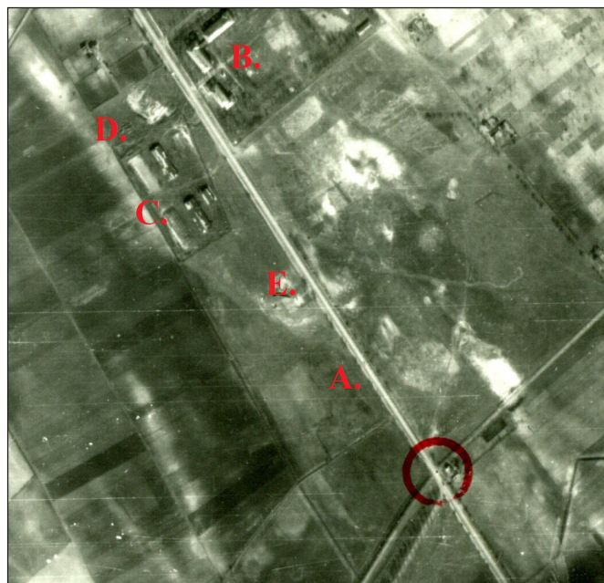
2. kép: 1950-ben készült légi felvétel részlete a bajai barakktábor területével (A.: vaskúti út, B.: volt határőrlaktanya, C.: barakktábor, D.: hadifogolytemető, E.: második világháborús emlékmű)