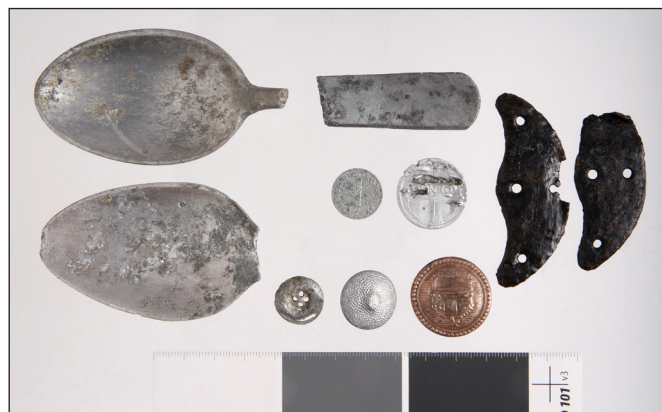
5. kép: 2024-ben talált evőeszköz-maradványok, ruházati emlékek és pénzermek a hadifogolytábor déli területéről (HM HIM – Hadirégészeti Gyűjtemény)

Az épülettartozékok sorába egy ácskapocs és egy zsanér maradványa tartozott. A ruházati emlékek közé két lábbelivasalás darabja, egy magyar köpenygomb, egy német zubbonygomb, valamint egy alsóruházati gomb tartozott. A használati tárgyak körét kizárólag evőeszköz-maradványok (két kanálfej és egy nyéltöredék) alkották. A pénzermek között egy darab 1 Filléres és egy darab 1 Pengős pénzérem volt (5. kép).