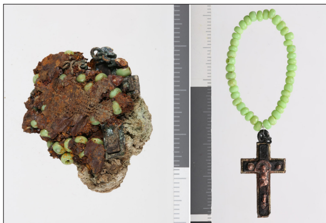
13. kép: A bajai második világháborús emlékmű mellett végzett 2024. évi exhumálási munkálatok során talált személyes tárgy – rózsafüzér maradványa