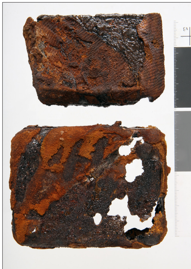
10. kép: A bajai második világháborús emlékmű mellett végzett 2024. évi exhumálási munkálatok során talált használati tárgyak (2.) – dohányszelencék maradványai