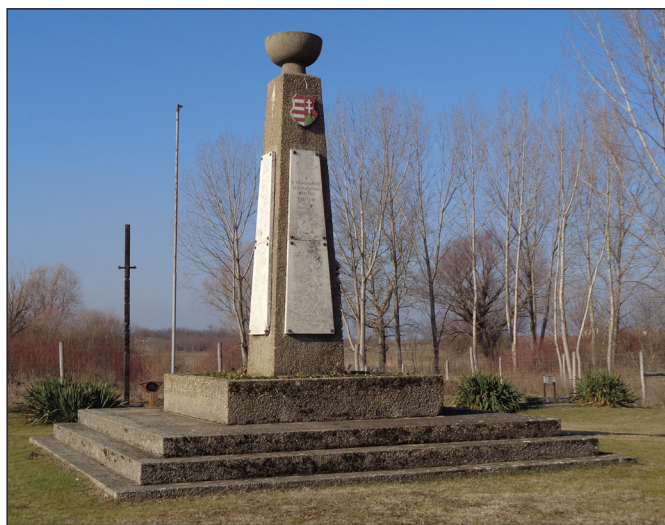
3. kép: A bajai vaskúti úti második világháborús emlékmű (1949)

A vaskúti úti hadifogolytábor területén tervezett építési munkálatokhoz kapcsolódóan 2018 novemberében próba jellegű kutatásokra került sor a HM Hadtörténelmi Intézet és Múzeum, valamint a Türr István Múzeum vezetésével, amely során az ásatóknak sikerült egy épület alapozását is megfigyelniük (Baja 015/44 helyrajzi számú földterületén). 2019 februárjában és márciusában a hadifogolytábor területétől északra, a tábornak az 1948. évi exhumálásokkor már feltárt temetési helyszínén folytatódtak a terepi munkálatok (Baja 015/45 helyrajzi számú földterületén). A kutatóárkok nyitását követően bizonyosságot nyert, hogy az 1948-as exhumálások után emberi maradványok maradtak vissza a sírgödörökben, így szükségessé vált a temetési hely újbóli feltárása. Az ásatók a mintegy 350 m 2 -es alapterületű helyszínen 26 egyéni és tömegsírt tártak fel.