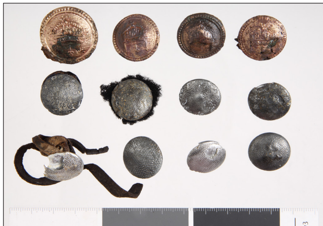
7. kép: A bajai második világháborús emlékmű mellett végzett 2024. évi exhumálási munkálatok során talált ruházati emlékek (2.) – magyar és német egyenruhagombok (HM HIM – Hadirégészeti Gyűjtemény)