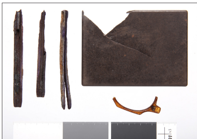
11. kép: A bajai második világháborús emlékmű mellett végzett 2024. évi exhumálási munkálatok során talált használati tárgyak (3.) – ceruzák, cigarettatárca és szemüveg maradványa

A ruházati emlékeket jellemzően a civil alsó és felső ruházati gombok, (német és magyar) egyenruha-gombok, valamint katonai és civil ruházathoz kapcsolódó csatok képezték (6–8. kép). A civil ruházathoz köthető gombok nyersanyaga igen nagy változatosságot mutatott, hiszen megtalálhatóak voltak közöttük a műanyagból, fémből, gyöngyházból, bőrből és fából készültek egyaránt. A használati tárgyak csoportját jellemzően evőeszközök darabjai, a dohányzáshoz, illetve a személyes higiéniahoz köthető tárgyak (dohányszelence, cigarettatárca, valamint zsebtükör, borotvapamacs, fésű) alkották, de ceruza és szemüveg maradványa is sorolható ezen tárgyak körébe (9–12. kép). A tükörtöredékek közül kiemelhető egy magát púderező hölgy képével díszített darab. A leletegyüttes egyik legfigyelemreméltóbb darabjának egy rózsafüzér maradványát (kereszt korpusszal és 42 üveggyönggyel) tartjuk (MÁTYÁSSY 2024, 116–117) (13. kép). Nehéz interpretálni az együttesbe tartozó két kulcsmaradványt (14. kép), hiszen a kulcsok hipotetikusan a hadifogolytáborba került civil személyekhez is kapcsolhatóak lehetnek. A pénzürmék közé