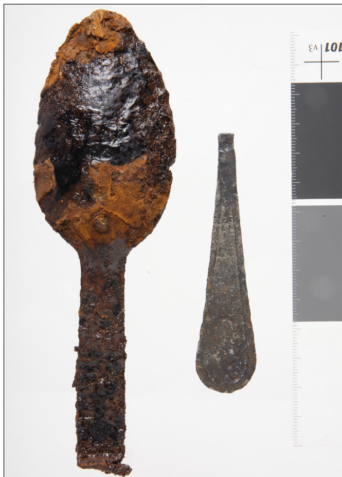
9. kép: A bajai második világháborús emlékmű mellett végzett 2024. évi exhumálási munkálatok során talált használati tárgyak (1.) – evőeszközök maradványai (HM HIM – Hadirégészeti Gyűjtemény)

Ezen irányelvek figyelembevételével a Hadtörténeti Múzeum Hadirégészeti Gyűjteményében 90 darab – a 2024. évi vaskúti úti kegyeleti feltárások során előkerült – tárgy került leltárba vételre, illetve feldolgozásra. A közgyűjteményi gyarapítás folyamatának részeként a leletek fertőtlenítésen és állagvédelmi mun-