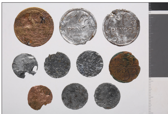
15. kép: A bajai második világháborús emlékmű mellett végzett 2024. évi exhumálási munkálatok során talált szovjet, lengyel és magyar pénzermék (HM HIM – Hadirégészeti Gyűjtemény)