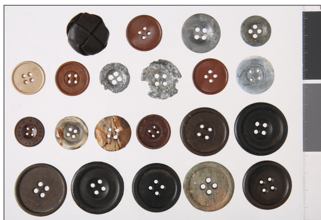
6. kép: A bajai második világháborús emlékmű mellett végzett 2024. évi exhumálási munkálatok során talált ruházati emlékek (1.) – civil ruházati gombok (HM HIM – Hadirégészeti Gyűjtemény)

A hősi temető és a hősi temetési hely fogalmát a temetőkről és a temetkezésről szóló 1999. évi XLIII. törvény értelmező rendelkezései között olvasható definíció (3. § f. pont) az alábbi módon határozza meg: „nemzetközi szerződés eltérő rendelkezése hiányában a honvédelmi kötelezettség fegyveres vagy fegyver nélküli teljesítése közben elesettek, továbbá a teljesítést követően, ezzel közvetlenül összefüggésbe hozható okból elhunytak, valamint háborúban kényszermunkára hurcoltak és elhunytak eltemetésére, hamvaik elhelyezésére szolgáló temető (temetőrész), temetési hely” (internetes forráshely: https://net.jogtar.hu/jogszabaly?docid=99900043.tv , a megtekintés ideje: 2024.10.09). (A hősi temetési helyek magyarországi kutatásának módszertanához lásd: DUDÁS, STIER & CZIDOR 2021.) Hősi temető, illetve hősi temetési hely feltárása, illetve az exhumáláshoz kapcsolódó munkálatok során előtalált tárgyi emlékek a háborús kegyeleti, muzeológiai, valamint műtárgyvédelmi szempontok megtartása mellett gyarapíthatóak múzeumi közgyűjteményben.