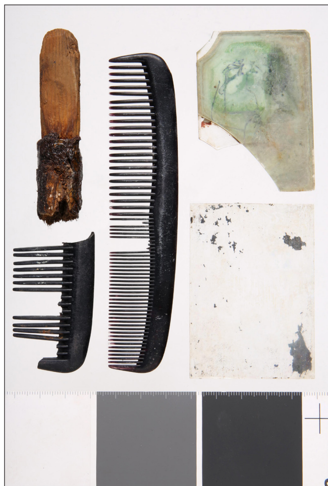
12. kép: A bajai második világháborús emlékmű mellett végzett 2024. évi exhumálási munkálatok során talált használati tárgyak (4.) – borotvapamacs maradványa, fésűk és zsebtükrök töredékei (HM HIM – Hadirégészeti Gyűjtemény)

szovjet (Kopejka), lengyel (Groszy) és magyar (Pengő, Filler) érmék tartoztak (15. kép). A fentebb bemutatott tárgycsoportokhoz nem illeszthető, egyéb leletek körébe egy kisebb kábelköteg, valamint egy kis méretű fémlap tartozott. Ezeknél a leleteknél hipotetikusan felmerülhet a másodlagos felhasználás szándéka. Névvél vagy monogrammal jelzett lelet nem található a vizsgált tárgyi együttesben. A leletek értelmezéséhez fontos szempont, hogy azok már egy másodlagos temetés helyszínén (korábbi exhumálási munkálatok után és az újra eltemetést követően) kerültek felszínre.