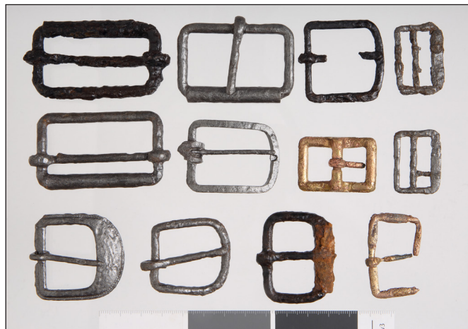
8. kép: A bajai második világháborús emlékmű mellett végzett 2024. évi exhumálási munkálatok során talált ruházati emlékek (3.) – civil és katonai ruházat csatjai (HM HIM – Hadirégészeti Gyűjtemény)

Ezen irányelvek figyelembevételével a Hadtörténeti Múzeum Hadirégészeti Gyűjteményében 90 darab – a 2024. évi vaskúti úti kegyeleti feltárások során előkerült – tárgy került leltárba vételre, illetve feldolgozásra. A közgyűjteményi gyarapítás folyamatának részeként a leletek fertőtlenítésen és állagvédelmi mun-