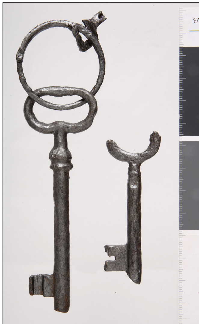
14. kép: A bajai második világháborús emlékmű mellett végzett 2024. évi exhumálási munkálatok során talált használati tárgy (5.) – kulcsok maradványai (HM HIM – Hadirégészeti Gyűjtemény)