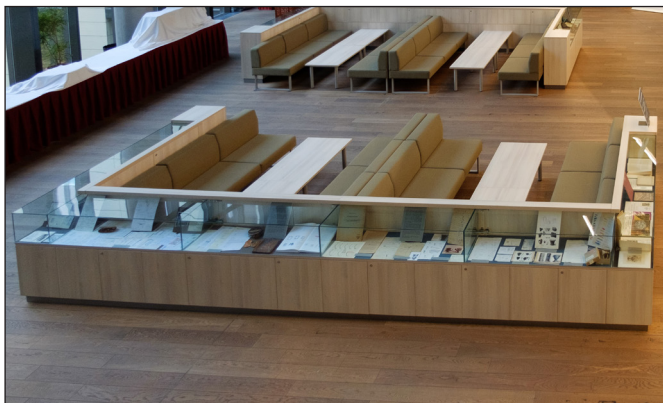
3. kép: A Holl 100 – Egy kutató mappáiból című kiállítás a Humán Tudományok Kutatóházában