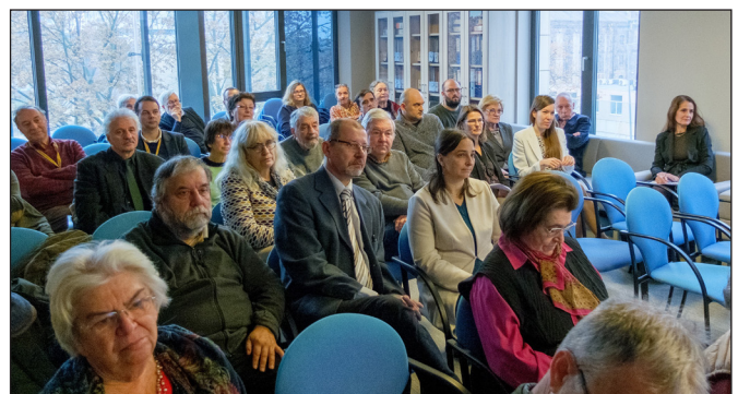
2. kép: A konferencia hallgatósága