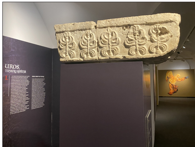
4. kép. 11. századi oszlopfő a Tihanyi Apátságból a kiállítás bejáratánál

A kiállítási katalógusban – ami a kiállítással azonos címe mellett az Egy tevékeny élet Szent Márton szolgálatában alcímet is viseli – az olvasók Uros apát emlékét először különböző tárgyi és írott emlékeken keresztül ismerhetik meg (SZOVÁK & TAKÁCS 2024). A kiállított tárgyak között fontos szerepet kapnak a régészeti leletek és kőfaragványok is.