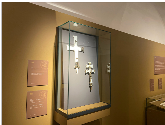
6. kép. Limoges-i oltár és körmeneti keresztek a tatárjárás során elpusztult templomokból