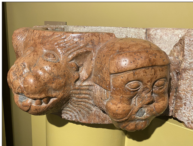
3. kép. Medencetöredék az apátsági templomból, 1220 körül