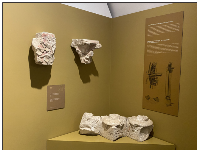
7. kép. A pannonhalmi Porta Speciosa töredékei, 1224 előtt