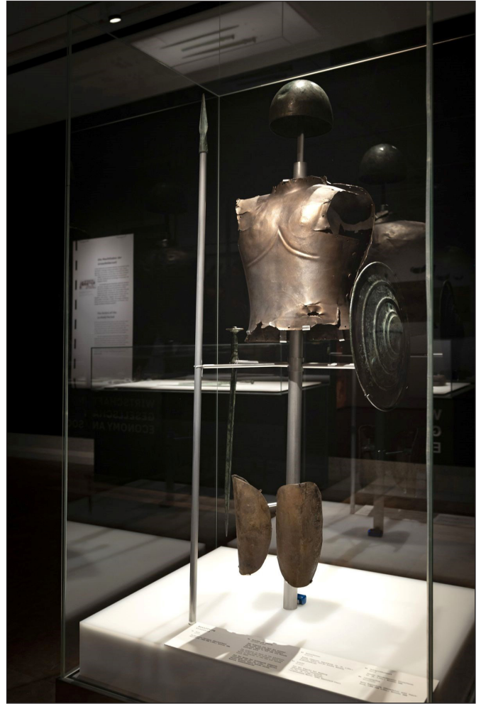
3. kép: A Dunában talált bronzkori mell-és lábvérték másolata/replikája a székesfehérvári Szent István Király Múzeum gyűjteményéből a nürnbergi kiállításon

Az essenbachi kocsisírban talált sírmellékletek, mint például egy súlykészlet, utalhatnak az elhunyt életében betöltött közösségi szerepére és rangjára. Egy kard is került a sírba, amelynek végét a temetést megelőzően elhajlították, ezzel talán azt hangsúlyozva, hogy ezt a fegyvert már az evilágon nem fogják használni. A többi közép-európai kocsisír is azt bizonyítja, hogy az urnevezős kultúra hordozói kizárólag a társadalom csúcsán álló uralkodó-