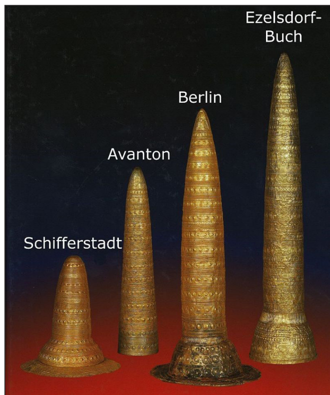
9. kép: Bronzkori aranysisakok https://burgthann.de/leben/sehenswertes/goldkegel-und-goldkegelplatz/

Hofmann, A. (2024) Die letzte Fahrt. Das urnenfelderzeitliche Wagengrab von Essenbach . Ausstellungskatalog. Nürnberg: Germanisches Nationalmuseum Abt. Verlag.