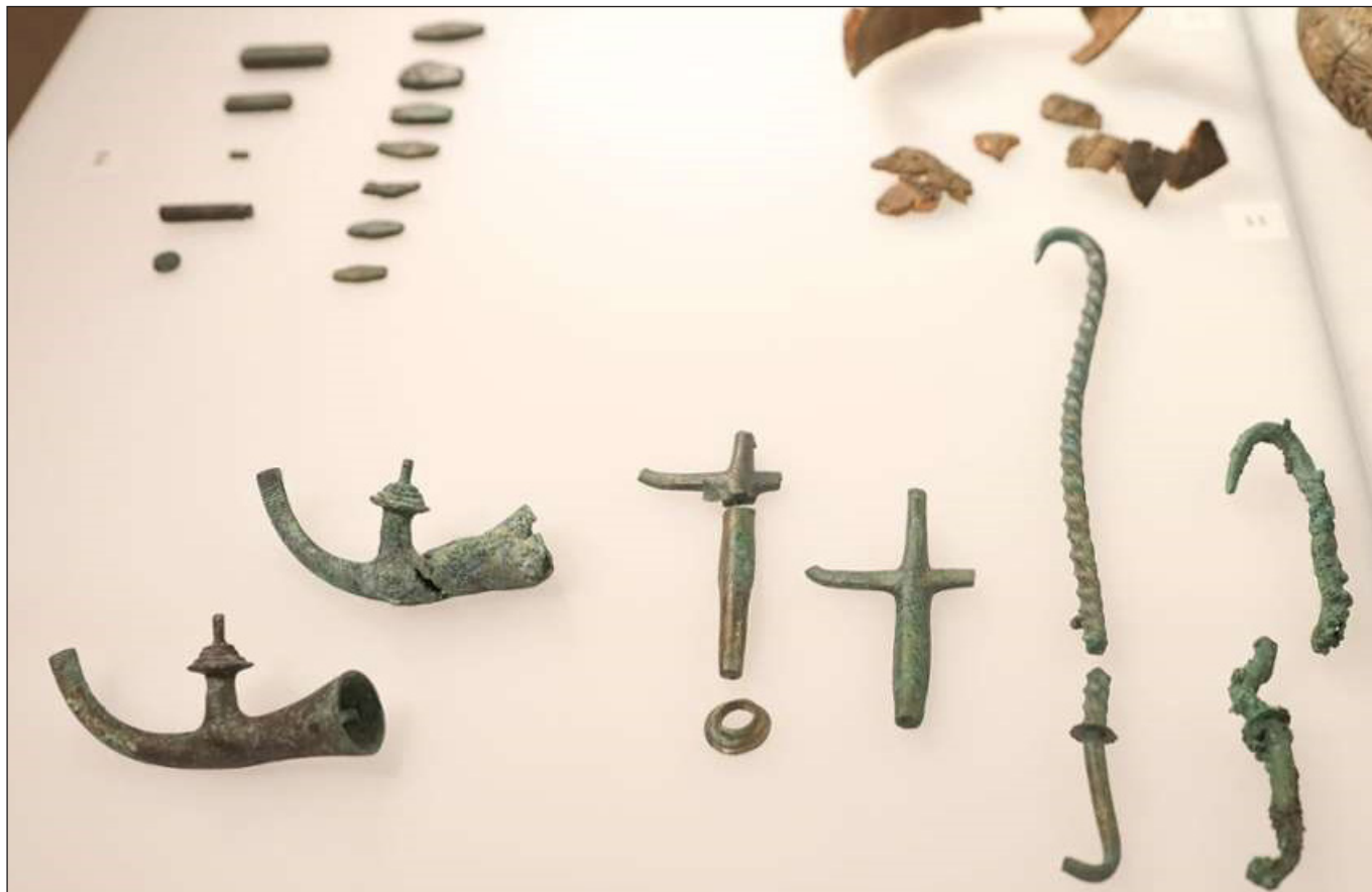
A rituális kocszi bronzveretei az essenbachi kocsisírból

https://www.stuttgarter-zeitung.de/inhalt.ausstellung-in-nuernberg-museumsschau-versammeltschaetze-aus-der-bronzezeit.1523ed49-c490-44c2-90b0-e5153a6ad1ae.html