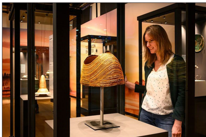
8. kép: Betekintés a leideni kiállítás tárlóiba. (Fotó: Mike Bink) https://www.rmo.nl/en/exhibitions/temporary-exhibitions/bronze-age/

most bemutatott tárgy között. A kiállítás központi témája a bronzfelhasználás következtében kialakult társadalmi változások, amiket az előbbieken bemutatott két kiállítás szintén tárgyalt. A leideni tárlat bemutatja, hogyan éltek és milyen eszközöket használtak 4000 ezer évvel ezelőtt a hétköznapokban: többek között látható egy 3500 éves fakanál és egy díszes bronz bortároló edény is. A bronzból készült tárgyak mellett fából, kerámiából, borostyánból, üvegből, bőrből és textilből készült használati tárgyak is kerültek a vitrinekbe. Mindezek mellett kiemelt szerepet kaptak az aranyeletek, ezzel is bemutatva az elkülönülő elit réteg megjelenését (8. kép).