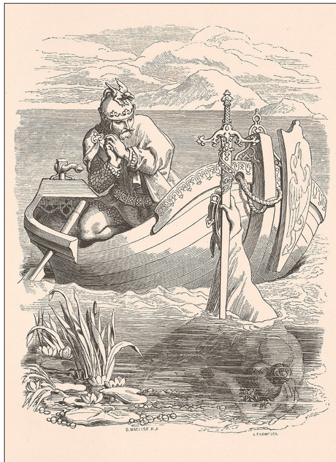
7. kép: Illusztráció a kiállításhoz kapcsolódó előadás programjából https://www.oldbookillustrations.com/illustrations/excalibur/