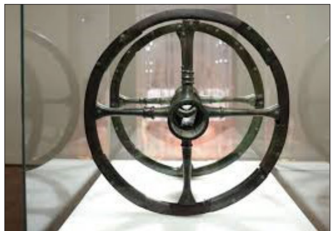
4. kép: Két bronzból készült küllős kocsikerék a nürnbergi kiállításon. A kerekek a romániai Arcailából származnak, jelenleg a Magyar Nemzeti Múzeum gyűjteményében találhatóak. https://www.stuttgarter-zeitung.de/inhalt/ausstellung-in-nuernberg-museumsschau-versammelt-schaetze-aus-der-bronzezeit.1523ed49-c490-44c2-90b0-e5153a6ad1ae.html