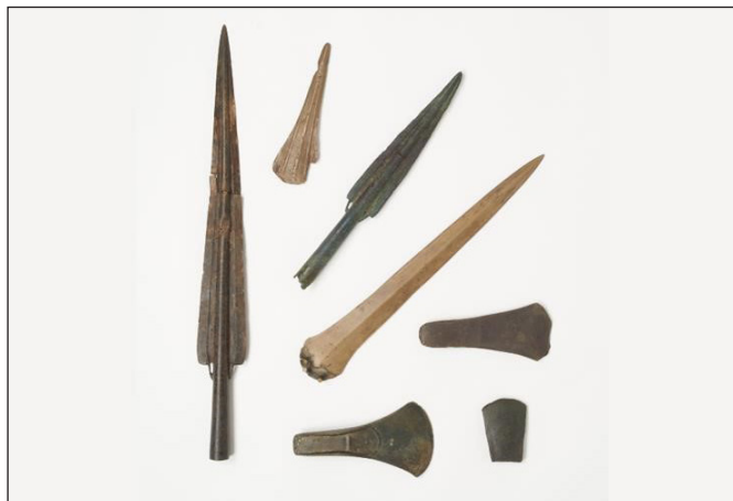
6. kép: A Trent folyóban és környékén talált eszközök

https://www.lakesidearts.org.uk/exhibition/bronze-age-offerings-in-the-river-trent/