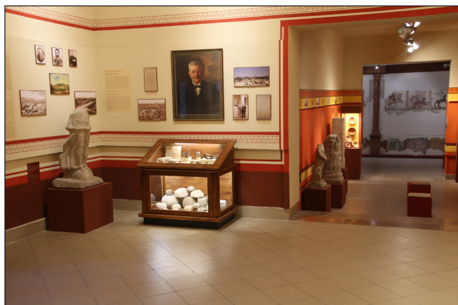
9. kép. Az „Aquincum 130 – A Java!” c. kiállítás bejárati helyisége a múzeumtörténeti tárlattal