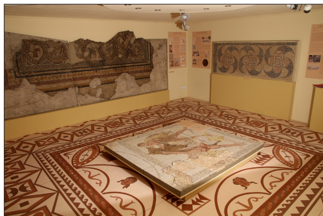
10. kép. Az „Apró kövek – színpompás padlók” című kiállítás enteriőrje

kiadványt, a második világháborúban megsérült múzeumi könyveket és az első ásatások leleteit (9. kép). A kiállítást múzeumpedagógiai eszközökkel, játékokkal tesszük vonzóvá a fiatalabb korosztályok számára, és az sem marad információ nélkül, aki magának a múzeumépületnek a történetére kíváncsi. A közelmúltban végzett restaurátori feltáró munka eredményeképpen a 20. század eleji padlóburkolat részletét ugyanúgy megmutatjuk látogatóinknak, mint az egykori, római kori falfestményekre emlékeztető színes faldekoráció eredeti részletét.