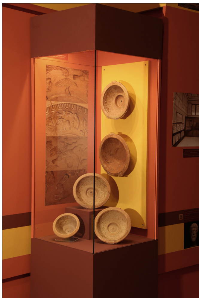
3. kép. Terra sigillata edények készítésére alkalmas ún. formatálak az aquincumi polgárváros keleti ipartelepéről