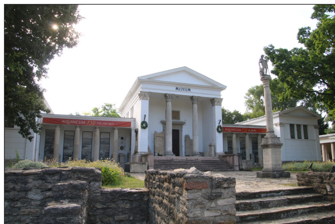
2. kép. Az aquincumi régi múzeumépület jelenlegi képe