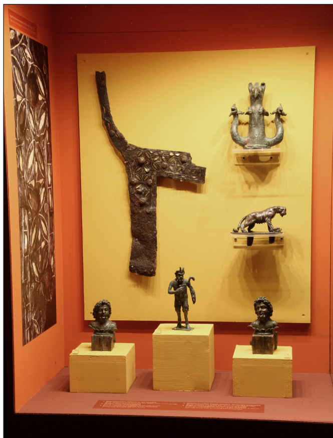
5. kép. Az ún. csillaghegyi római kocsi elemei a kiállításban