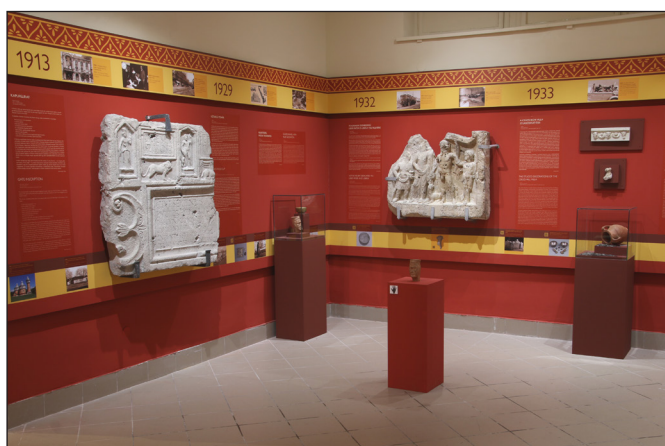
7. kép. Az „Aquincum 130 – A Java!” c. kiállítás enteriőrje

A hagyományosnak tekinthető régészeti kiállításrész – amely a múzeumépület északi és déli szárnyai-ban kapott helyet – a központi, bejárati teremben egy múzeumtörténeti tárlat egészíti ki, hiszen végső soron ez az épületrész nyílt meg 1894. májusában. A teremben, amely részben visszakapta az eredeti, 19. század végi belső faldekorációit is, az első feltárások és a múzeumalapítás történetének képi, írott, illetve tárgyi emlékeit mutatjuk be: festményeket és korabeli fotókat, levelezéseket, a múzeum alapítólevelét, vendégkönyvi bejegyzéseket; valamint a látogatók „elhagyott” személyes tárgyait, egy 20. század eleji múzeumi