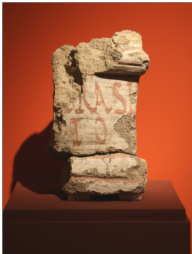
6. kép. Festett, feliratos oltárkö az aquincumi katonaváros Mithras-szentélyéből

meg, illetve olyan aquincumi tárgyak fotóit és rövid leírásait mutatjuk be, melyek jelenleg más, állandó kiállításainkban láthatók (pl. víziorgona, a gyalogsági bronzsisak vagy éppen Fortuna Nemesis szobra) (7–8. képek).