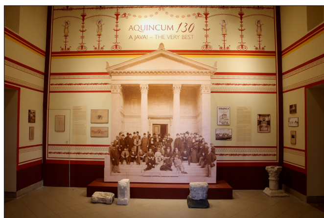
8. kép. Az „Aquincum 130 – A Java!” c. kiállítás bejárati helyisége a múzeumtörténeti tárlattal