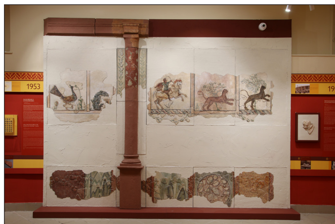
4. kép. Falfestményrészlet az aquincumi katonaváros egyik fogadjából (Pacsirtamező u. 65)

(3–6. képek). A látványos és szép tárgyak hosszabb leíró jellegű szöveget kaptak a hagyományos tárgyelíratok helyett. A sajátos időszalagra felfűzött tárgycsokor felett egy sávban Budapest történetének legfontosabb mérföldkövei jelennek meg (a Keleti pályaudvar 1884-es megnyitásától a Queen 1986-os, népstadionbeli koncertjén át a Corvin Áruház műemléki homlokzatának 2023-as felújításáig), amellyel egyrészt reflektáltunk Aquincum modern főváros-utódja, Budapest 150. születésnapjára is, másrészt így talán közelebb tudjuk hozni a város lakók – de akár a turisták – számára is az aquincumi feltárások nagy korszakait. A két időszakot a kiállítóterek falainak alsó részén még egy sáv kíséri, melyen a fontos aquincumi ásatásokról emlékezünk