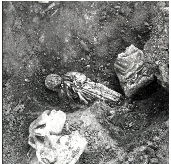
1. kép. A szobrok megtalálása, 1974. február