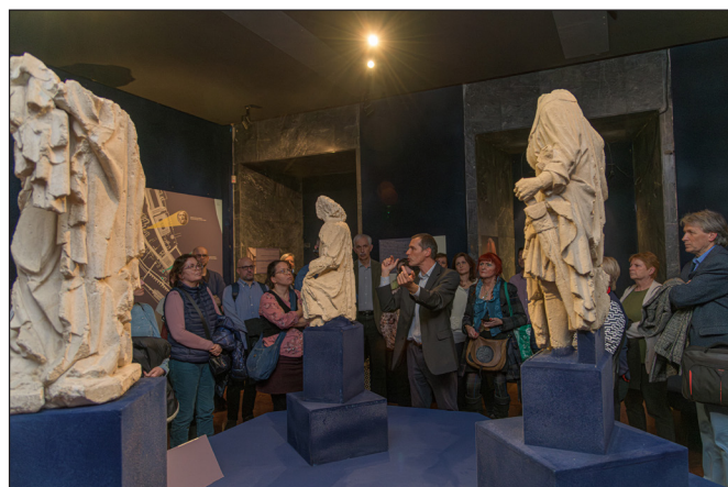
5. kép. Vezetés a szoborkiállításon a konferencia záróeseményeként, 2024. március 4.