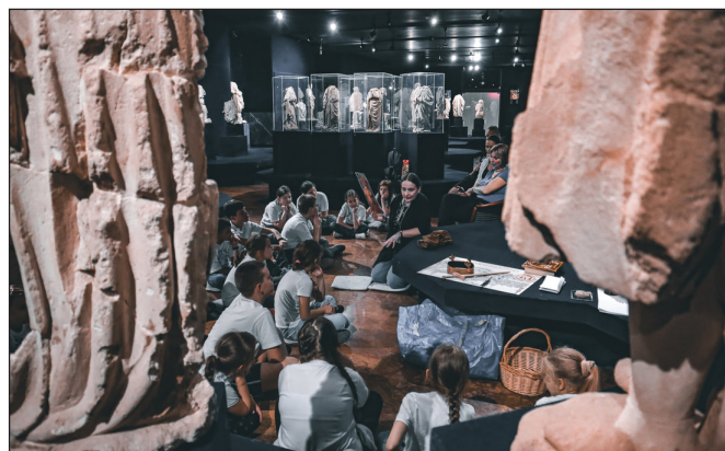
7. kép. Gyerekfoglalkozás a szoborkiállításon, 2024