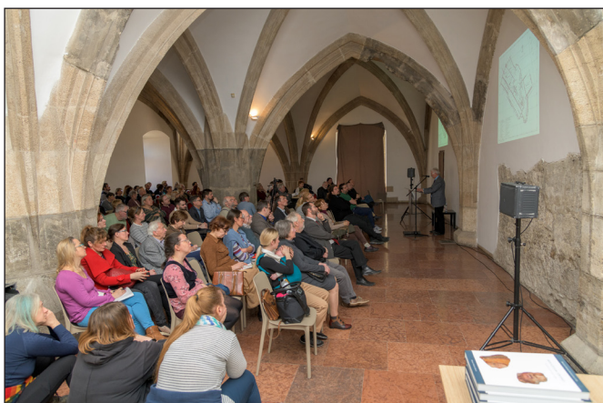
4. kép. Gótikus szobrok 50. Évforduló, tudományos konferencia, 2024. március 4.

Az 1987-es, Luxemburgi Zsigmond korát bemutató kiállítás, majd Végh András és Magyar Károly rendezésében 1992-ben a szobrokat bemutató új kiállítás megint az érdeklődés középpontjába helyezték a közben a nyilvánosság számára már kissé elfeledett leletegyüttest. Újraindult a tudományos diskurzus, aminek újabb lökést adott 1994-ben a Szent Zsigmond templom feltárása a palota szomszédságában, a Szent György téren, ahol a szoboregyüttes máig legfontosabb testvérlelete került elő. Az egykor a templomban állt Krisztus-figura töredékei egy gödörből kerültek elő alaposan összetörve és megégve. A faragvány jelentőségét az adta, hogy ez volt az eddigi egyetlen olyan szobor, ami stilisztikailag egyértelműen az 1974-es