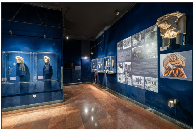
2. kép. A felújított Gótikus szoborkiállítás, 2023. november