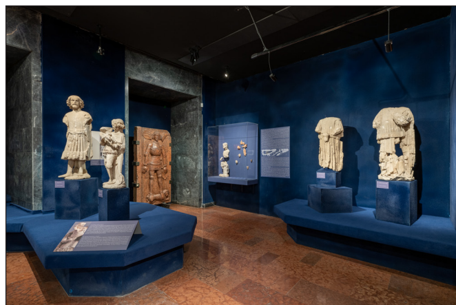
3. kép. A felújított Gótikus szoborkiállítás, 2023. november

mukba a feltárást látogatókat: „Az alkonyat beálltával eufórikus hangulatban hagytuk ott a helyszínt...” (MAROSI 1998).