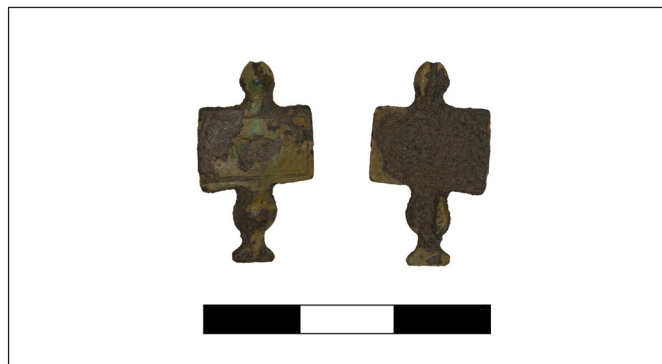
6. kép. Emailos fibula Szolnok–Szandaszőlős V. lelőhelyről