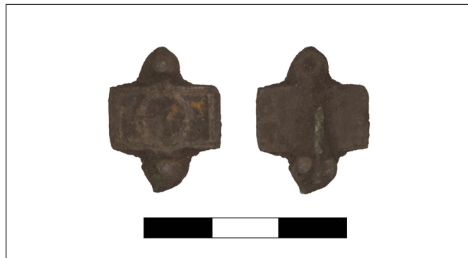
8. kép. Emailos fibula Kétpó–Deák dűlő lelőhelyről