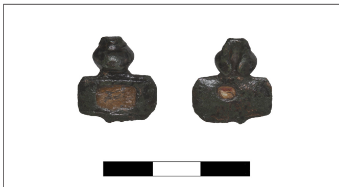
3. kép. Emailos fibula Újszász–Nyaraló-halom II. lelőhelyről