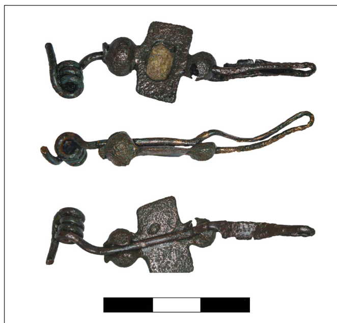
2. kép. Emailos fibula Újszász–Tápió-dűlő lelőhelyről

A legnépesebb csoportot alkotják ezek a példányok, eddig 9 db ismert belőlük. A típus mérete változó; a lemez szélessége 1–1,7 cm között mozog. Lelőhelyeik Tiszapüspöki–Fehértó-part felett (1. kép 7; F. KOVÁCS 2020, Pl. I.8, III.8; 2021, 2. kép 8), Jászfákóhalma–Négyszállási tó (2 db 1. kép 3–4; F. KOVÁCS 2020, Pl. I.3–4, III.3–4; 2021, 2. kép 3–4), Jászfákóhalma–Szászegyház (1. kép 2; F. KOVÁCS F. KOVÁCS 2020, Pl. I.2, III.2; 2021, 2. kép 2), Újszász–Tápió-dűlő (2. kép), Újszász–Nyaraló-halom II. (3. kép), Mezőhék–Kollárt-halom (4. kép), Szajol–Szajolföld II. (5. kép) és Szolnok–Szandaszőlős V. (6. kép). Hasonló típusú fibulák ismertek nagy számban Zenum környékén, köztük egy ép darab is (DIZDAR 2014, 99). A Szarajevó közelében fekvő kamenjačai temetőből is származik egy ilyen típusú fibula, aminek érdekessége, hogy egyfajta csüngőként volt használatban, valamint La Tène B2 Duchcov fibulákkal együtt volt a női sírban (DIZDAR 2014, 100). Ennek a csoportnak a kronológiája még nem tisztázott, mert számos példány kontextus nélküli. J. Todorović és P. Popović a Kr. e. 1. századra keltezi ezeket (TODOROVIC 1971, 150–153, Pl. LXVIII.9, 12, 14; POPOVIC 2002,