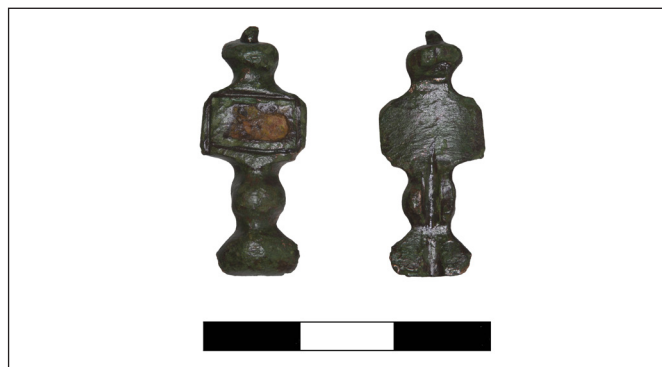
4. kép. Emailos fibula Mezőhék–Kollárt-halom lelőhelyről