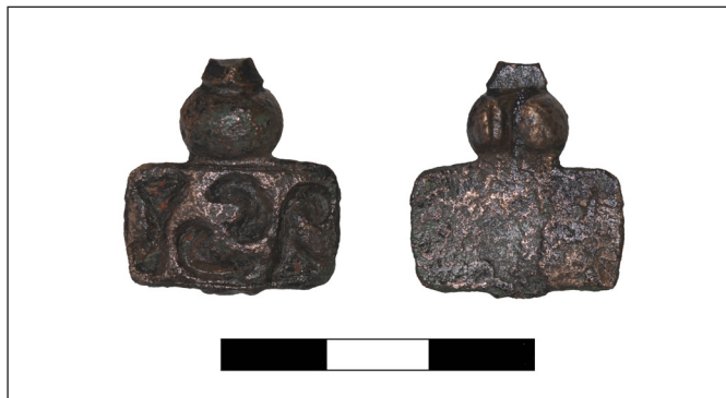
7. kép. Emailos fibula Öcsöd–Kincstári földek lelőhelyről

Öcsöd–Kincstári földek lelőhelyről jutott be egy példány, amelynek lemezén négy motívum figyelhető meg (7. kép): középen két egymásba kapcsolódó félkör, a széleken pedig egy-egy homokórára emlékeztető minta. A típus ismeretlen a szakirodalomban.