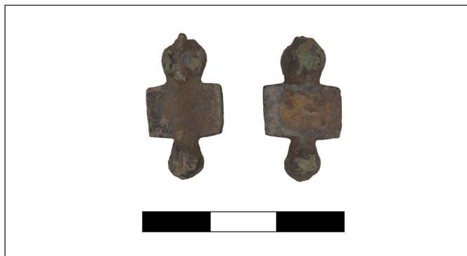
5. kép. Emailos fibula Szajol–Szajolföld II. lelőhelyről