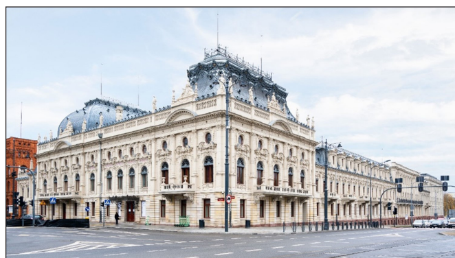
3. kép. Poznański palota – Városi Múzeum, Łódź

Lehetőség nyílt még ellátogatni az úgynevezett „földalatti katedrálisba” is, amely valójában a város 1930-as években épített vízgyűjtő rendszere. A négy hatalmas ciszterna 15 millió liter víz befogadására alkalmas, és biztonsági okokból nem látogatható – a