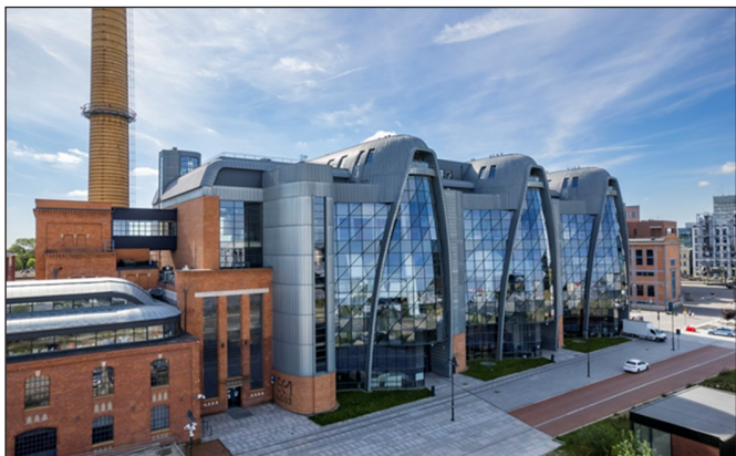
2. kép. A fórum helyszíne: Science and Technology Centre EC1 Łódź - City of Culture

fórum résztvevői a program keretében az egyik víztelenített ciszternát tekinthették meg (4. kép).