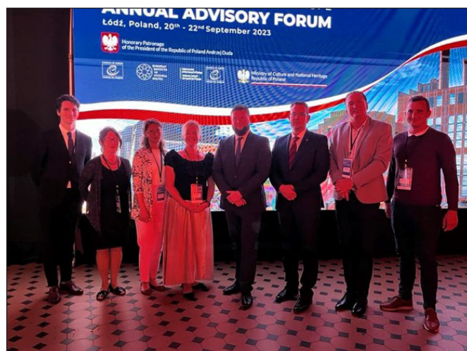
5. kép. A jövő évi szakértői fórum magyar vendéglátói

Utolsó eseményként bejelentették, hogy a 2024. évi szakértői fórumra 2024. szeptember 25–27. között, Visegrádon kerül sor. A programot magyar részről hárman ismertették: Vincze Máté közgyűjteményekért és kulturális fejlesztésekért felelős helyettes államtitkár, Csonka Takács Eszter igazgató, a magyarországi kulturális útvonalak koordinátora, valamint Eőri Dénes, Visegrád polgármestere (5. kép).