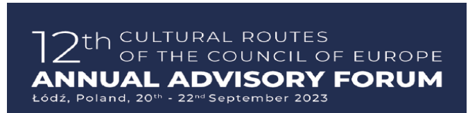
1. kép. Az esemény logója

Az Európa Tanács által 1987-ben újjára indított Kulturális Útvonalak program (1. kép) egy térbeli és időbeli utazáson keresztül mutatja be, hogy Európa különböző országainak öröksége hogyan járul hozzá a közös kulturális örökséghez. A Tanács által megítélt tanúsítvánnyal rendelkező útvonalak egyrészt a kultúrák közötti párbeszéd csatornáiként működnek, másrészt hozzájárulnak Európa természeti és kulturális örökségének megőrzéséhez, továbbá elősegítik a fenntartható fejlődés elvárásainak megfelelő kulturális turizmust. A program egyik kiemelt eseménye az évente megrendezésre kerülő szakértői fórum, ahol kihirdetik az adott évben minősítést nyert új útvonalakat. Idén ennek a lengyelországi Lódz adott otthont.