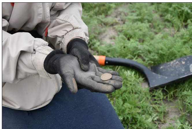
4. kép. Római kori érme Bezenye határából