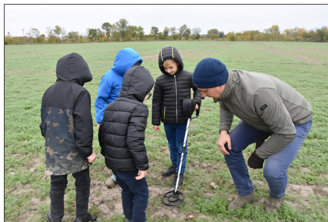
5. kép A programon résztvevő gyermekek ismerkednek a fémkereső használatával