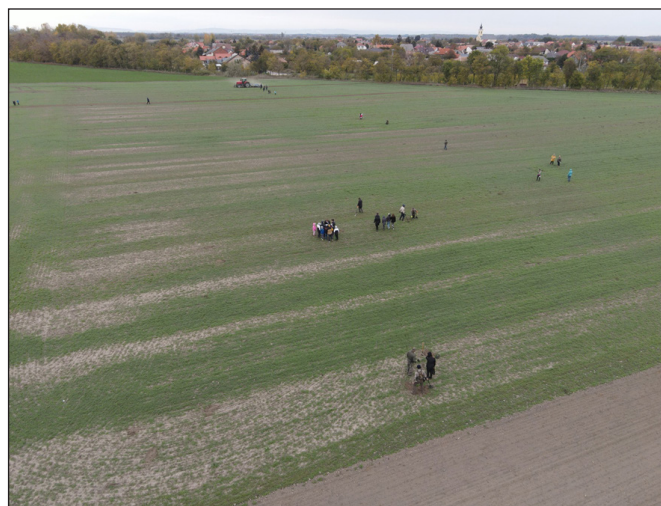
3. kép. Drónfelvétel a Bezenye határában folytatott közösségi régészeti programról

Ennek szellemében fogalmazódott meg az ötlet, hogy Bezenye helyet adhatna a közösségi régészet eszköztárának gyakorlati bemutatására. A helyi községi önkormányzat és az általános iskola diákjai bevonásával folyt fémkeresős vizsgálat a település délnyugati részén egy ismert, de régészetileg mindmáig nem kutatott területen. A 19. században Sötér Ágost (SÖTÉR 1898), majd fél évszázaddal később