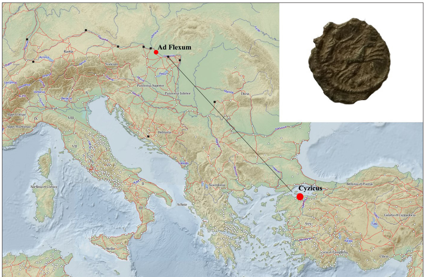
2. kép. I. Constantinus érme Cyzicus verési hellyel Hegyeshalomból (készítette: Cz. Németh Veronika)