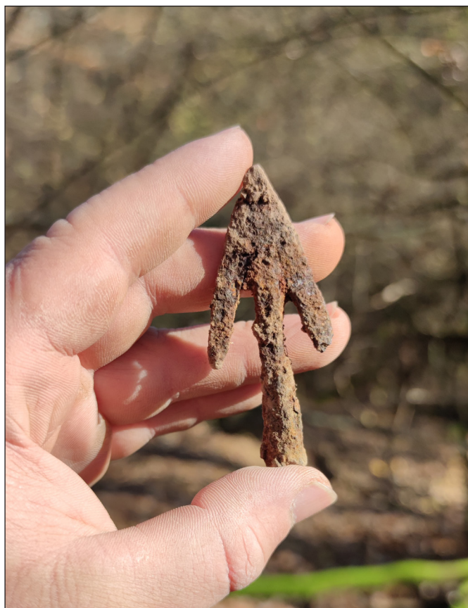
1. kép. Kelemér – Mohos-vár, nyílhegy az omladékból

A hangsúly a hasznosság érzésén van – főleg egy olyan világban, ahol csak az elsők, az aranyérmesek számítanak. Önkénteseink minden esetben tisztában vannak azzal, hogy tevékenységükkel nemcsak önnön kíváncsiságukat elégítik ki, hanem a régészeti leletek, lelőhelyek megmentése szempontjából is hasznos munkát végeznek. Például a kora Árpád-kori temetők feltárása során egyértelmű üzenetet kaphatnak arról, hogy szó szerint az utolsó órában vagyunk (RÓZSA, SZIGETI & VIDA 2022), hiszen az erózió és az azt sokszor kiváltó mezőgazdasági művelés pár év alatt a temetők nagy részét megsemmisíti. Topográfiai kutatásaink során hangsúlyozzuk azok megelőző jellegét (fő csapásirányunk a fejlődő térségek úthálózatát