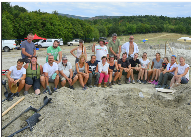
3. kép. Csoportkép Alsótold honfoglalás kori temető feltárásán

követi: 83-as út, M3 autópálya/M30-as út, Tisza-tó környezete). Olyan példamutatás ez, amely révén a társadalom széles rétegeihez juthat el üzenetünk, miközben a helyi tudatot, és az összetartozás érzését is erősítjük, az örökség védelme mellett. A közösen végzett munka fontosságát mutatja az is, hogy az eredményekről igyekszünk példás gyorsasággal beszámolni, immár önálló kiadványsorozatunk hasábjain is, amelynek első kötete az elmúlt év karácsonyára meg is jelent (RÓZSA & SZIGETI 2022).