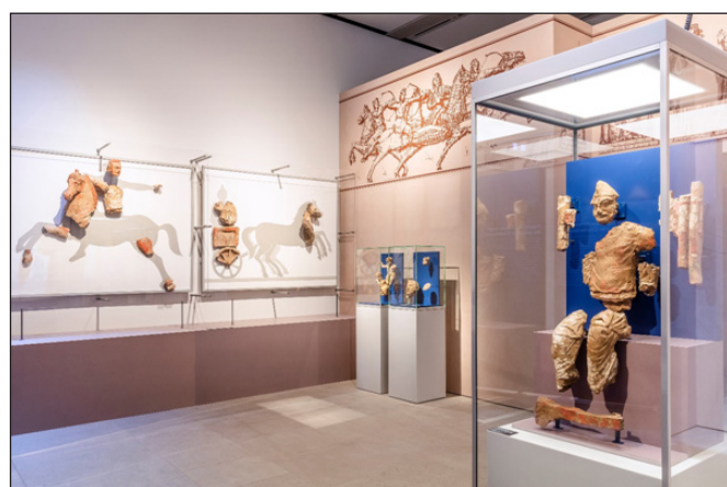
4. kép. Részlet a kiállításból

Nagy Sándor az isszoszi csata idején 23 éves volt, és akkor még senki sem sejtette, hogy ennek a tehetséges ifjúnak már csak tíz éve van hátra. A Nagy Sándor által elűzött perzsa királyt Besszosz szatrapa gyilkolta meg, aki igényt tartott a perzsák trónjára is. Nagy Sándor csapataival az üldözésére indult, átkelt a Hindikuson és az afgán sivatagon, és