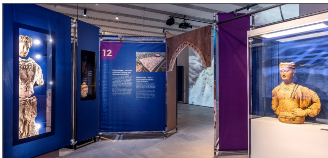
2. kép. Részlet a kiállításból