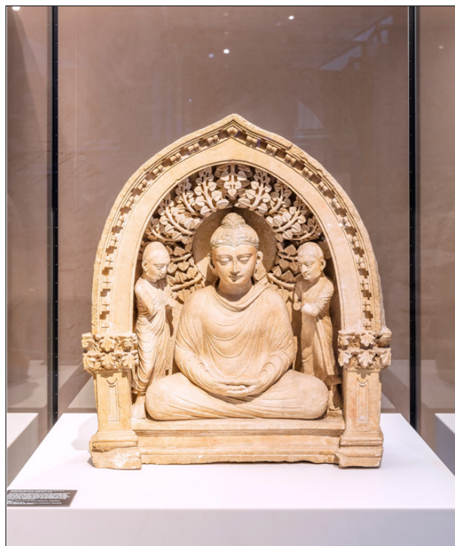
5. kép. A gréko-buddhizmus finoman megművelt darabja egy korai Buddha szobor

A kiállításhoz egy katalógus is készült, melyet a berlini Kadmos kiadó jelentetett meg: Manfred Nawroth & Matthias Wemhoff, Hrsg.: Archäologische Schätze aus Usbekistan. Von Alexander dem Großen bis zum Reich der Kuschan. Puhakötés, 448 oldal, 500 színes és fekete-fehér illusztrációkkal. ISBN 978-3-86599-545-2, € 49,80)