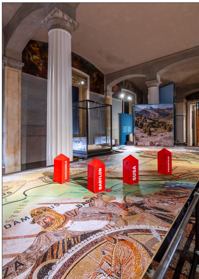
3. kép. III. Dareiosz perzsa nagykirály a Nagy Sándor-mozaik másolatán és Nagy Sándor hódításainak útvonalai a múzeum padlóján

eljutott az Óxosz folyóig (mai nevén Amur Darja). Akkoriban ez volt a természetes határ Baktria és Szogdiáné között, ugyanakkor a nyugati birodalmak ezt tartották a „világ végének“. Nagy Sándort azonban ez sem állította meg; Kr.e. 329-ben átűzte Besszoszt az Óxoszon, majd elfogatása és kivégeztetése után saját magát koronáztatta meg perzsa királlyá. Itt már le is telepedhetett volna, de mivel Indiába akart eljutni, tovább nyomult új birodalmában észak felé a következő nagy folyóig, a Jaxartészig (mai nevén Szir-Darja) és ott alapított új várost „Legtávolabbi Alexandria“ néven (ma Hundzsand/Khujand, Tadzsikisztán). A folyó egyik partján a szogdok, a másikon a szkíták éltek, és egyikük sem örült a betolakodónak; ezt számos lázadással és gyakori támadásokkal adták az uralkodó tudtára. Nagy Sándor ezért a határvidékeken több erődöt is építtetett, melyek a kiállításon drónfelvételeken és fotókon láthatók. Az új király a meghódított területeken elterjesztette a hellén kultúrát, új helytartókat állított a városok élére és új pénzérméket veretett. Ezen tevékenységek hírmondói az itt talált leletek, pl. a Nagy Sándor drachmák, a görög motívumokkal díszített használati tárgyak és a mives aranyékszerek.