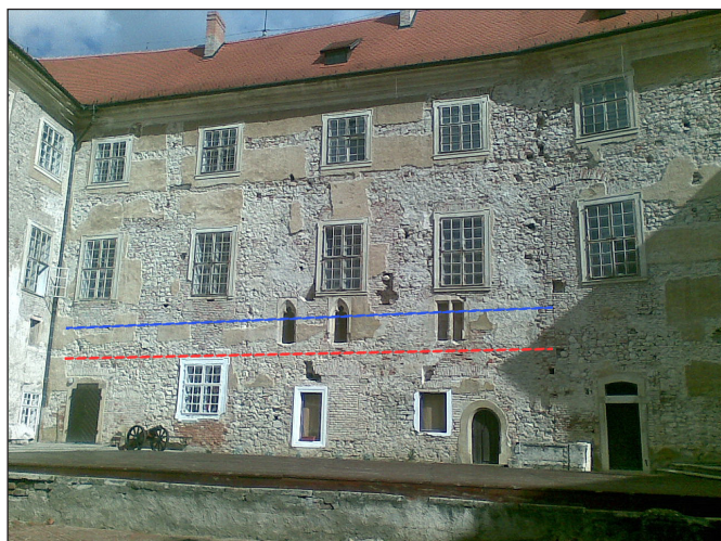
3. kép: Siklós, vár, keleti szárny, sematikusan jelölve a belső járószint emelése (Bartos György falkutatói megfigyelése, 2009)

ként álljon itt a siklói vár példája, (3. kép) ahol a keleti, 15. századi épületszárny első emeletének padlószintjét a 16. század elején megemelték közel fél emeletnyi magassággal. Ennek érdekében a gótikus ablakokat befalazták, a padlószintet feltöltötték, és ehhez igazodva egy új, magasabb, reneszánsz ablaksort alakítottak ki a későbbi első emeleti barokk ablakok helyén (BARTOS & CABELLO 2007, 84). A földszinti boltozat feletti földfeltöltés ennek megfelelően 15. század végi, 16. század eleji leletanyagot tartalmazott, de előkerült épített kályhaalap is. A hazai szabályozásból fakadóan viszont mindez az épületkutatás (falkutatás) keretében – sőt annak kivitelezés közbeni fázisában – került kihordásra; az más kérdés, hogy a művészettörténész falkutató tapasztalata „megmentette” a helyzetet. A fenti szituáció egyúttal arra világít rá, hogy a két munkamódszer az esetek egy kisebb részében teljesen szétválaszthatatlan. Nem más ez, mint a 19. század második felében alkalmazott „műrégészet” modern kori változata.