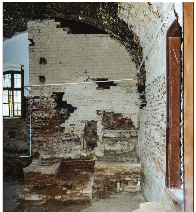
1. kép: A söjtöri Deák-ház feltárt konyhája (Koppány András kutatása, 2002)

Az 1711-es korszakhatár mellett létezik egy térbeli, mégpedig „horizontális” határ is. A kulturális örökség védelméről szóló 2001. évi LXIV. törvény ugyanis – e sorok írásakor – a régészeti örökséget „az emberi létnek a föld felszínén, a föld (...) felszíne alatt, (...) 1711 előtt keletkezett érzékelhető nyomaként” határozza meg. A lelőhely pedig nem más, mint ennek a részhalma, térbeli vetülete. A földfelszín nyilvánvalóan azért számít, mert ezáltal a terepbejáráson talált leletek alapján is lelőhellyé lehet nyilvánítani egy területet, függetlenül attól, hogy a régészeti rétegződés a földfelszín alatt milyen mélyen kezdődik. Városi feltárások esetén, ahol az „1711 előtti” rétegeket vastagabb újkori, sőt legújabb kori rétegződés is borítja, ezek eltávolítása a bevett gyakorlat szerint gépi földmunkával történik (ZSIDI 2011, 120).