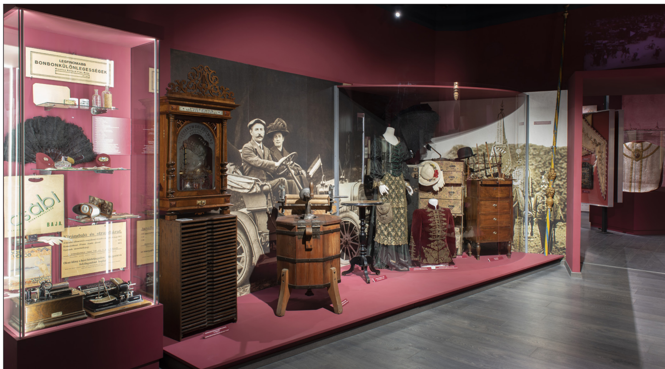
7. kép. A történelmi tárlat részlete (7. egység – Polgári kultúra Baján a 19. században és a 20. század elején)

A kiállításához az Interreg IPA projektek támogatásával különleges online vezetőt készítettünk, ahol a különböző „állomásokon” applikációk segítségével juthat további élményszerű információkhoz a látogató. Továbbá az AR és VR-technológiát is beépítettük a tárlat minden részébe, mely a tudományos ismeretszerzés mellett a játék, a szórakozás interaktív élményét nyújtja a látogatóknak.