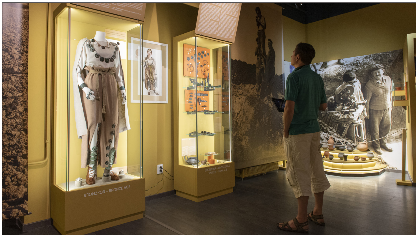
2. kép. A régészeti tárlat részlete a sükösdői gazdag bronzkori viselet rekonstrukciójával (1. egység – Földöntúli gazdagság)

sötétebb kereszt alakú furat látható, amely jellegzetesen bronzkori fényzimbólum (1. kép). Mellékletekként a lábak közelében egy a korra jellemző kisbőgrét, két tengeri csigát és egy különleges, finoman csiszolt, tojás alakú követ találtunk (2. kép). Azonban már ennél korábbi leletekkel is büszkélkedhetünk, amelyek hiánypótlóak Baja környéke neolitikumának bemutatása tekintetében. 2019-ben, Dávodon bukkantunk egy különleges, 7000 éves, déli irányból érkezett közösség temetőrészletére. A frissen megtalált, hiteles körülmények között előkerült újkőkori sírok a Sopot-Bicske kultúrához tartoznak.