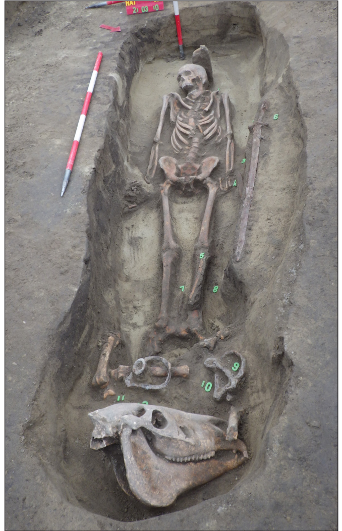
4. kép. A nemesnáduvardi honfoglalás kori I. sír

A kiállítás régészeti részének zárásaként a múzeum közvetlen szomszédságában, Baja belvárosában, az egykori középkori városmag területén lezajlott 2018-as és 2020-as feltárások leleteit mutatjuk be a 16. századtól a kora újkorig datálható leletekkel. A hódoltság időszakára keltezhető török érmék területünkön az első fontos leletek a korszakból. Számos egyedülálló tárgy, többek közt egy