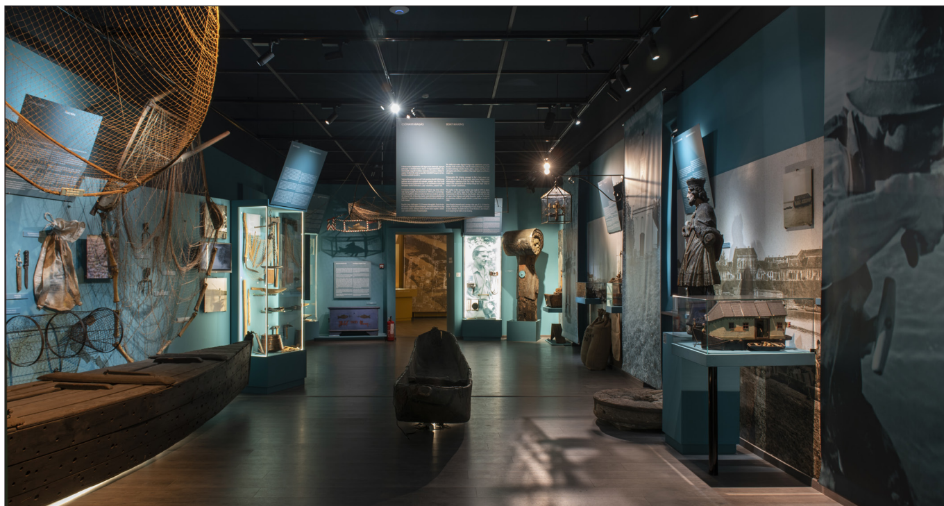
6. kép. A néprajzi tárlat részlete (3. egység – Víz és ember )

csontból faragott napóra, vagy egy láncos, balkáni eredetű drótékszer is napvilágot látott. A meglévő kiállítási anyagot remekül ki tudtuk egészíteni az önkéntes fémkeresősök által beszolgáltatott leletekkel, köztük a bronzkori szórványleletekkel, vagy a honfoglalás- és középkori tárgyakkal.