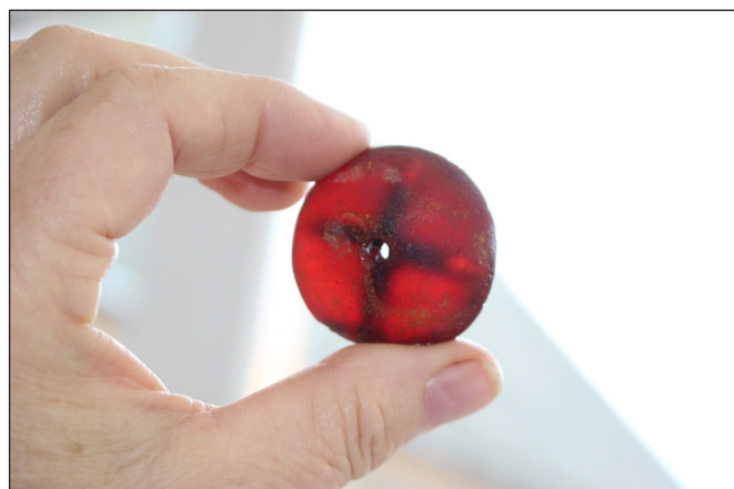
1. kép. A félgömb alakú borostyán csüngő Sükösdről

A kiállítás több dimenzióban mutatja be Baja város történetét az őskortól napjainkig. A régészet két teremben jelenik meg, ezzel indul a kiállítás egy bevezető, rövid épülettörténet után. Alapvetően időrendben – az őskortól a késő középkorig – mutatjuk be a tárgycsoportokat a legfrissebb kutatási eredményeket is felsorakoztatva. Olyannyira frisseket, hogy a 2020 decemberében Sükösdön, egy leletmentés során feltárt, egyedülálló bronzkori sír leletanyaga is már a kiállítást gazdagítja. Folyamatban van egy, a temetkezést bemutató különleges „idősűrített” animáció (time-lapse) készítése is, amely segít elképzelni a látogatóknak egy bronzkori temetkezést. A Halomsíros kultúrához kötődő fiatal nő sírjában érintetlenül, ún. in situ helyzetben tudtuk megfigyelni a viseleti elemeket: a sarló alakú, korongos fejű tüket, korong alakú tuskés csüngőket, melyek a nyakában és a lábánál szép számmal sorakoztak. Kettős spirál díszes gyűrűket, vastag, bordázott karpereceket, nagyméretű lábtekerceket. Az egyik leghíresebb eleme a sírnak a félgömb alakú borostyán csüngő, mely a nyakában átfűrt tengeri kagylók és fog alakú borostyán csüngő „társaságában” került elő. Az ékszer a fény felé fordítva tárja fel titkát: a ragyogó vörös korongban egy