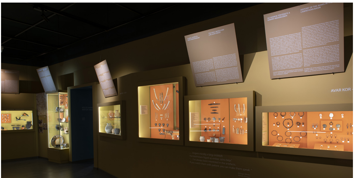
5. kép. A régészeti tárlat részlete (2. egység – Út a pogányságtól a kereszténységig)