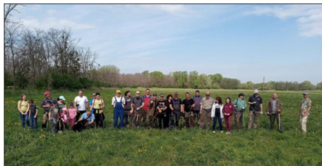
1. kép. Indul a Pápai Múltkutatók munkája Pápan, a Sávolyi dűlőben

Kutatásainkat a Pápai járás területén végezzük. A Pápai járás Veszprém megye északi részén található, székhelye Pápa, amelyhez 48 község tartozik (2–3. kép). Területe 4463 km 2 , ami Veszprém megye területének közel egynegyed részét (23%-át) teszi ki. Földrajzi szempontból a terület összetett: déli részén a Magas Bakony található, aminek folyókkal és patakokkal tagolt felszíne északnyugati irányban süllyed a Pápai-síkságba. A Pápai-síkságon északnyugati irányba folynak a patakok a Marcal-Rába vonal felé.