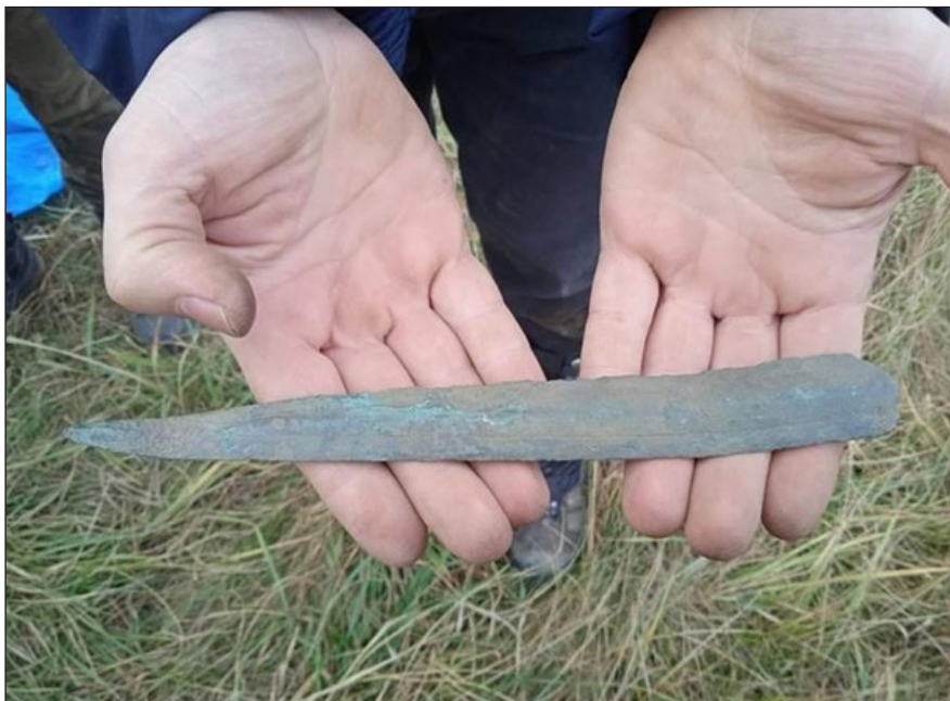
6. kép. Késő bronzkori kard pengéje Homokbödögéről; Herczeg Ferenc találata