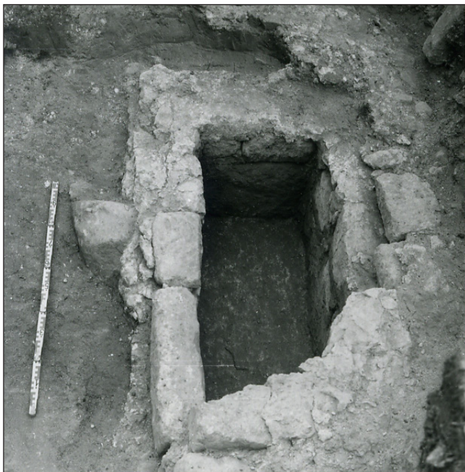
5. kép: A szentély előtt feltárt épített sír

korú temetkezésekről van szó, amelyek között azonban elkülönül a soros temető korábbi szokásaihoz hű közössége és a templom mellé temetkező, a keresztény rítushoz közelebb álló sírok csoportja. Ez utóbbiak az ispáni vár urainak, akár az ispánnak és családjának a temetkezései is lehetnek.