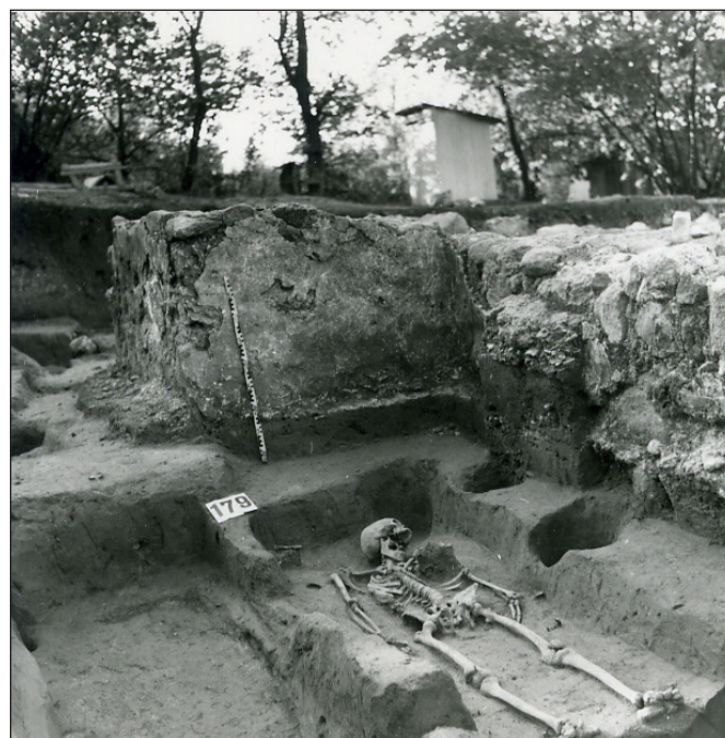
7. kép: A 6. képen látható két sír a bontás egy későbbi fázisában