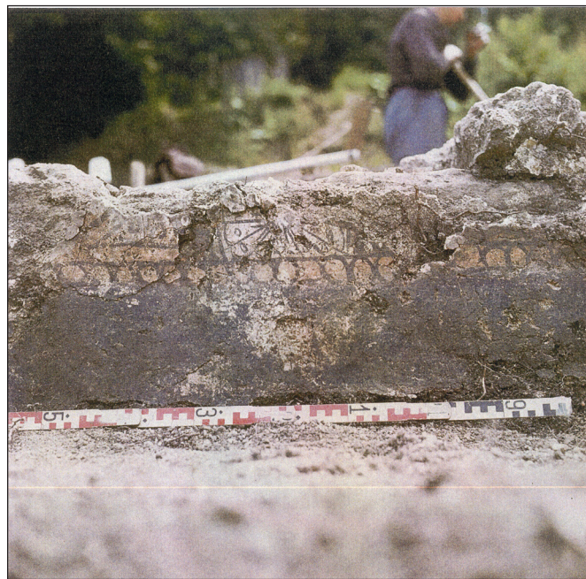
2. kép: A falfestmény részlete a szentély déli falának lábazati részén

Ezt a nagy gonddal kialakított, jelentős művészi alkotásokkal díszített templomot azonban már a 12. század közepén elhagyták. Pusztulási rétege nem mutat nagyobb traumát, rombolást, de terminus ante quem keltezhető egy, a déli mellékoltár pusztulási rétege alatt talált 12. századi éremmel. Hogy a templomot egyszerre hagyták-e fel vagy funkciójának elvesztése után fokozatosan vált egyre jelentéktelenebbé és néptelenedett el, nem tudjuk. Mindenesetre a felhagyás eseményéhez köthető, hogy a temető egyes sírjait kiürítették, a holttestek maradványait valószínűleg magukkal vitték. Ezek után a temető használata is befejeződött, a templom épületében és környékén csupán másodlagos használat szórványos nyomait lehetett felfedezni.