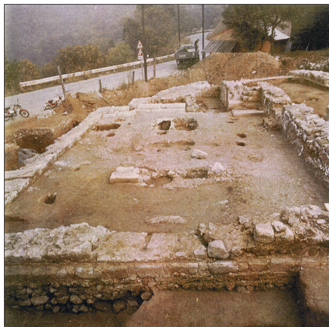
1. kép: A plébániatemplom feltárása 1978-ban, a nyugati homlokzat irányából

Az épület igényes kivitelezése, díszítése, mérete azt sugallja, hogy jelentős egyházi intézmény lehetett, és erre utal a szentély előtt fellelt, már a templom fennállása során kialakított épített sír is. A templom szentélyének két oldalán egy-egy mellékoltár is megfigyelhető volt, egész belső terét terrazzo padló borította, falait pedig falfestmények díszítették. E szépen