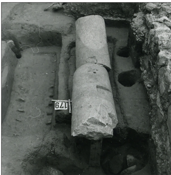
6. kép: A melléképületen belül feltárt két sír: jobb oldalon a sírkőként használt római oszloppal, bal oldalon az exhumált sírral

A soros temetőrészben és a második templom nyugati oldalán is megfigyelhető egy-egy olyan sírcsoport, amelyben a közösség fontosabb tagjai nyugodtak. Mellékletben gazdag sírok – a soros temető esetében érmek (Salamon, Géza dux, I. Géza, I. László), hajkarikák, gyöngy nyakláncok, vadkan agyar, nyílhegyek –, a templom körüli rész esetében szintén érem (I. László), arany, ezüst hajkarikák és gyűrűk, az egyik síron sírkőként elhelyezett római kori oszloptörredék– jelzik a sírokban nyugvók magasabb társadalmi státuszát, gazdagságát. A templom melletti három felnőtt (két férfi és egy nő) sírjának előkelő voltát egy-egy mellékletként adott arany karikagyűrű is jelzi. A mindkét csoportnál fellelt, korhatározásra alkalmas érmek (Salamon, I. Géza, I. László) valószínűsítik, hogy nagyjából egy-