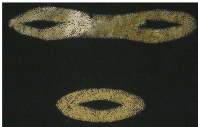
3. kép: 8–10. századra keltezhető különálló szem- és szájszemes Gorbunjata lelőhelyről (Fodor István: Ősi halotti maszkok . Kiállítási katalógus. Budapest, Magyar Nemzeti Múzeum 2013, 33. kép)

A halotti maszkok és szemfedők használata térben és időben széles körű elterjedést mutat egész Euráziában a paleolitikumtól az antikvitáson át a kora újkorig. 22 A Kárpát-medence 10–11. századi hagyatékában elkülönített halotti szemfedők a kelet-európai, különösen az Urál vidéki kora középkori leletanyagában megfigyelt hasonló darabokkal, valószínűleg hasonló temetkezési szokások nyomaival mutatnak nagyfokú kapcsolatot. Az Urál nyugati előterében egykor élt ugor népesség körében jellemző rítust — mely a honfoglaló leletanyagban is feltűnik — a keleti régészeti kutatás legtöbb szakértője az egyik legfontosabb ugor etnikumjelzőként tartja számon, melyről az elmúlt évek szerencsés leletei kapcsán jelentős mennyiségű új szakirodalom született. 23 A magyarok 9. század első felében az Urál nyugati előterének kulturális elemeiből többet is magukkal vittek először a kelet-európai füves sztyepp vidékére, majd a Kárpát-medencébe. A halotti szemfedő-