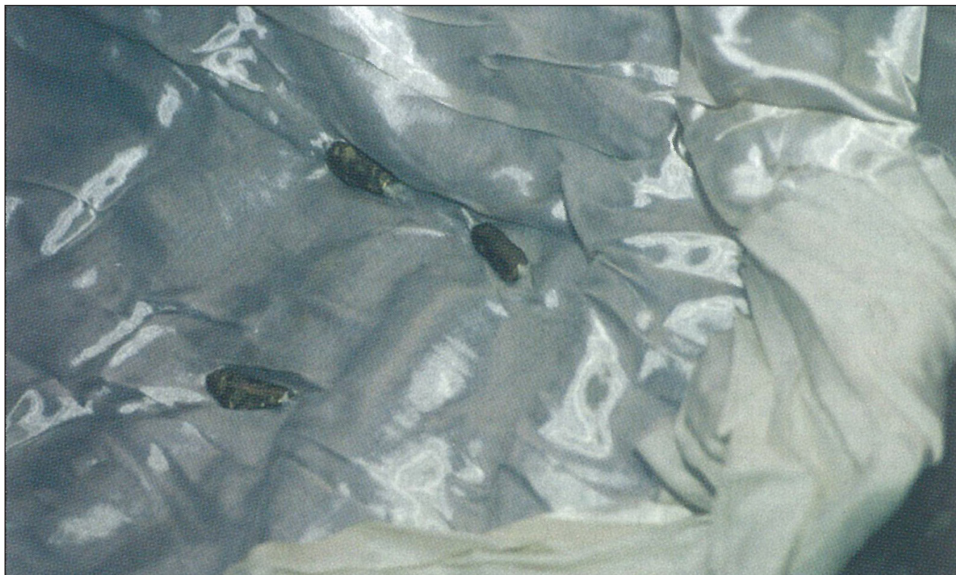
6. kép: Halotti arclepel szem- és szájlemezekkel (Benkő Mihály: Nomád világ Belső-Ázsiában (Nomadic life in Central Asia) Budapest, Timp 1998, 129)

Benkő Mihály belső-ázsiai utazásai során több évet töltött a mongóliai kazakok közt, különféle szokásaikat vizsgálva. Így nyert bepillantást halotti szertartásaikba is, melynek során szemfedőt adtak halottaiknak. Az elhunyt arcát fehér selyemleppel terítették le, a lepelre pedig arany, ezüst, a szegényebbek esetében pedig bronz pénzeket vagy lemezeket varrtak a szemek és a száj helyére (6. kép). 32 A helyiek elbeszélése