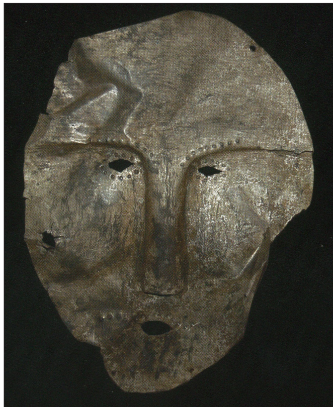
5. kép: Egész arcot takaró halotti maszk Bajanovo lelőhelyről (Fodor István: Ősi halotti maszkok. Kiállítási katalógus. Budapest, Magyar Nemzeti Múzeum 2013, 35. kép )

kön kívül példaként megemlíthetők a posztszaszanida hatású tárgyak, és az egyes sírokban megfigyelhető részleges lovas-temetkezések stb.