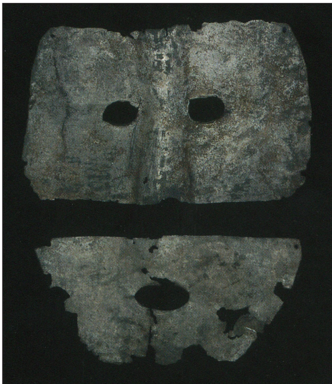
4. kép: 9. századra keltezhető különálló szem-és szájlemez Bajanovo lelőhelyről (Fodor István: Ősi halotti maszkok. Kiállítási katalógus. Budapest, Magyar Nemzeti Múzeum 2013, 34. kép )