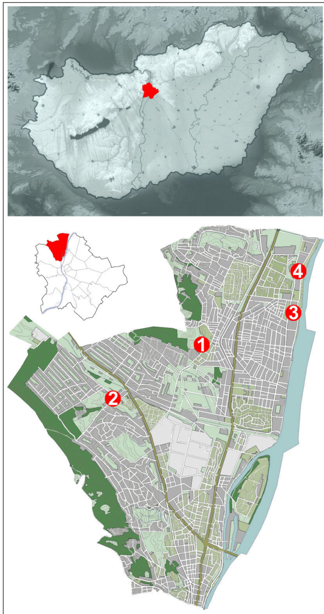
1. kép: A bemutatott lelőhelyek elhelyezkedése – 1.: Pusztakúti út 12., 2.: Csúcshegy-Harsánylejtő, 3.: Királyok útja 225., 4.: Királyok útja 291–295. (az alaptérképek forrása: https://www.idokep.hu , http://www.oplab.sztaki.hu ; készítette: Tóth Farkas Márton)

Csillaghegyen – a III. kerület más részeihez hasonlóan – az utóbbi 10–20 évben intenzív ingatlanfejlesztés kezdődött meg. A korábbi ipari, vagy beépítésre alkalmatlannak ítélt területeken gomba módra nőnek ki az új lakóparkok, irodakomplexumok. Az építkezéseket kísérő régészeti megfigyeléseknek és feltárásoknak köszönhetően számos új lelőhelyet sikerült megkutatnia a BTM munkatársainak. Az egyik ilyen „rozsdáövezet” a Pusztakúti úton az egykori téglagyár területe, ill. annak agyagnyerő bányája. A 235 m tengerszint feletti magasságot elérő, nagyrészt dolomitból felépülő Péter-hegy a Pilis-hegység délkeleti csücskében helyezkedik el, az Ürömi- és a Róka-hegy között. Keleti lábánál több helyen kiscelli agyagot bányásztak csillaghegyi téglagyárak számára a 20. század elejétől a 80-as évek végéig (SCHAFARZIK ET AL. 1964; www.egykor.hu ). A gyár területén, illetve annak tágabb környezetében folytatott kutatások során korábban kora-középső rézkori, késő bronzkori, kora és késő vaskori, római kori, Árpád-kori és középkori megtelepedés bizonyítékai kerültek napvilágra.