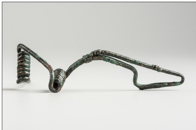
6. kép: Kelta bronz fibula tárolóverem alján feltárt omladékrétegből (Csúcshegy-Harsánylejtő)