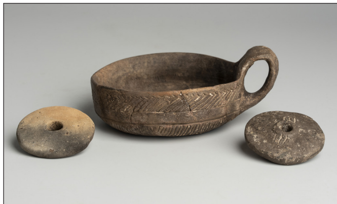
2. kép: Középső rézkori orsókarikák és tűzdelt barázdás díszű csésze (Pusztakúti út 12.)