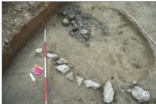
7. kép: Félig földbe mélyített kelta épület, padlóján összetört edénytöredékekkel (Csúcshegy-Harsánylejtő/Csengőbojt utca)