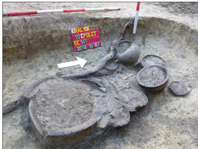
5. kép: Késő bronzkori, körkörösén pozicionált edényeket tartalmazó, szórthamvasztásos sír (Királyok útja 225.)

információk alapján nincs számottevő különbség, csupán territoriális szempontból értelmezhetjük őket két külön temetkezési helyként.