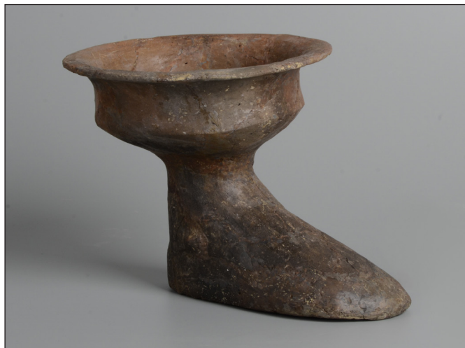
4. kép: Csizma alakú edény késő bronzkori sírból (Királyok útja 225.)