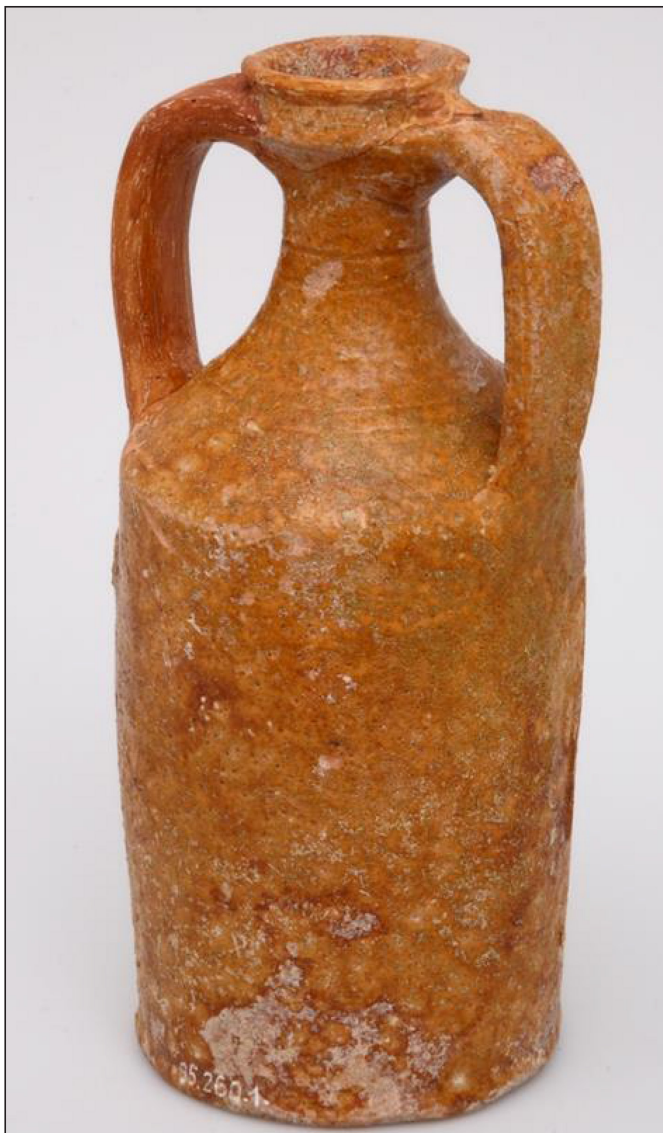
1. kép: Mázas kétfülű palack Esztergomból, Ltsz.: 95.260.1.

képi anyaga 11 is segített az elkülönítésnél. A könnyebb érthetőség érdekében az adott típusokat egy nagyobb, funkció szerinti csoportba soroltam, ezek nem képezik a tipológia alapját, csupán funkció szerinti elkülönítést jelentenek. Ezek a formák néhol eltérő alakot mutatnak a ma általunk korsónak, tálnak, bögrének stb. hívott edényekhez képest. Elsődleges feldolgozásban összesen 13 főtípust állapítottam meg. Funkció szerinti csoportok a Tárolóedények (1. típus: korsó; 2. típus: kancsó; 3. típus: palack [1. kép]); Ivóedények (4. típus: bögre; 5. típus: pohár; 6. típus: csésze); Dörzstál (7. típus: dörzstál); Tálalóedények (8. típus: tál; 9. típus: tányér);