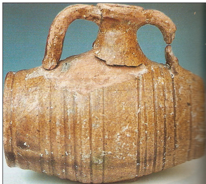
2. kép: Mázas hordó alakú edény Csákvárról (Nádorfi 2000, 90/2. kép)

képi anyaga 11 is segített az elkülönítésnél. A könnyebb érthetőség érdekében az adott típusokat egy nagyobb, funkció szerinti csoportba soroltam, ezek nem képezik a tipológia alapját, csupán funkció szerinti elkülönítést jelentenek. Ezek a formák néhol eltérő alakot mutatnak a ma általunk korsónak, tálnak, bögrének stb. hívott edényekhez képest. Elsődleges feldolgozásban összesen 13 főtípust állapítottam meg. Funkció szerinti csoportok a Tárolóedények (1. típus: korsó; 2. típus: kancsó; 3. típus: palack [1. kép]); Ivóedények (4. típus: bögre; 5. típus: pohár; 6. típus: csésze); Dörzstál (7. típus: dörzstál); Tálalóedények (8. típus: tál; 9. típus: tányér);