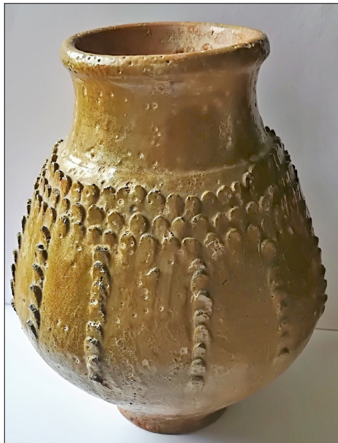
4. kép: Pikkelyes díszítésű mázas edény Dunaújvárosból. Ltsz: 67.2.302.13

római középrétegben terjedhetett el, ezen belül is inkább a tehetősebbek engedhették meg maguknak. 13 Viszont a tömeggyártás elterjedésével ez is változhatott.