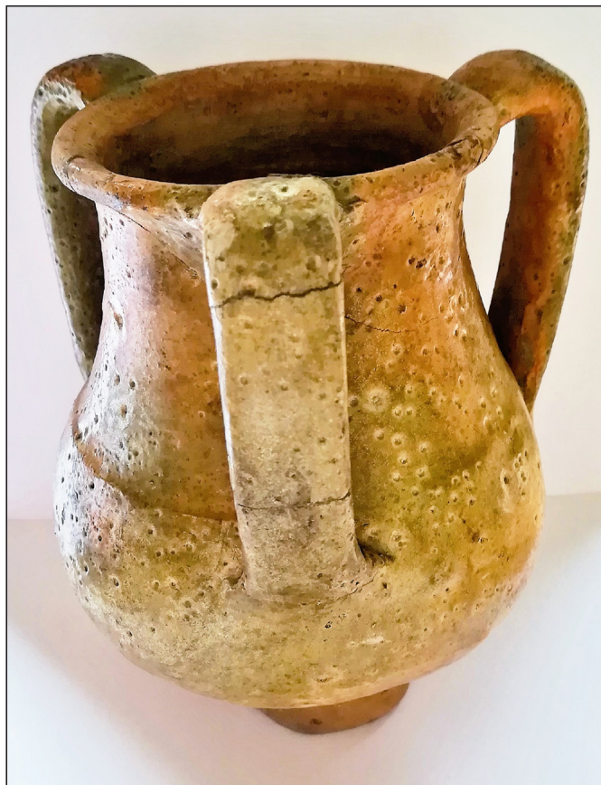
3. kép: Háromfülű edény Dunaújvárosból. Ltsz: 67.2.88.12