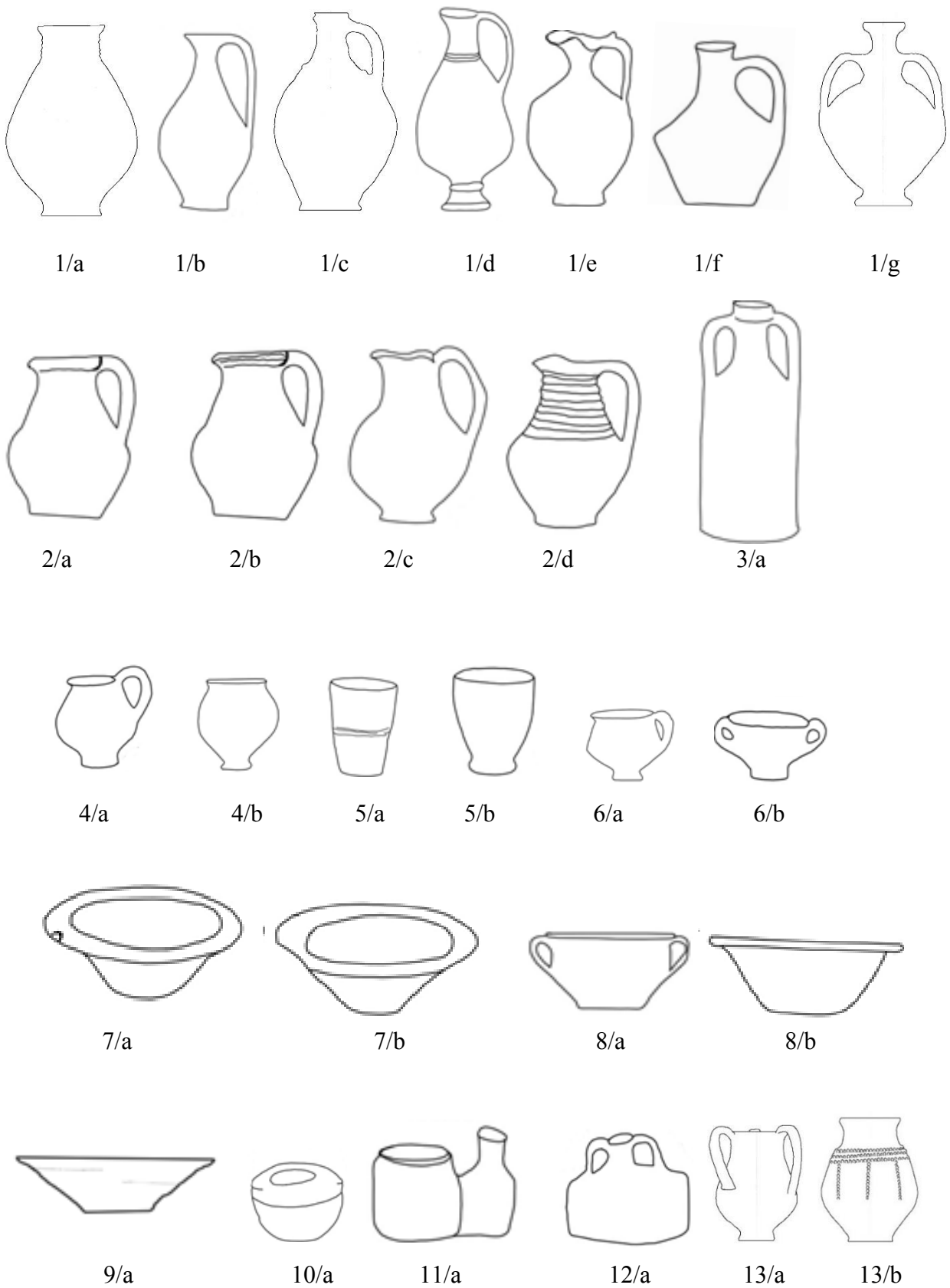
1. táblázat: A késő római mázas kerámia tipológiai táblázata