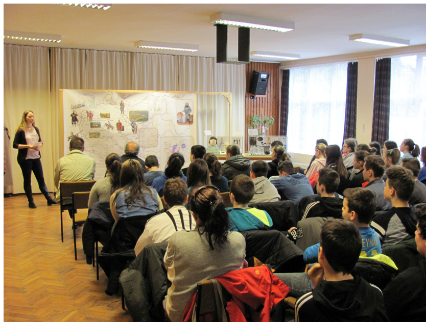
3.kép: Előadás a diákoknak