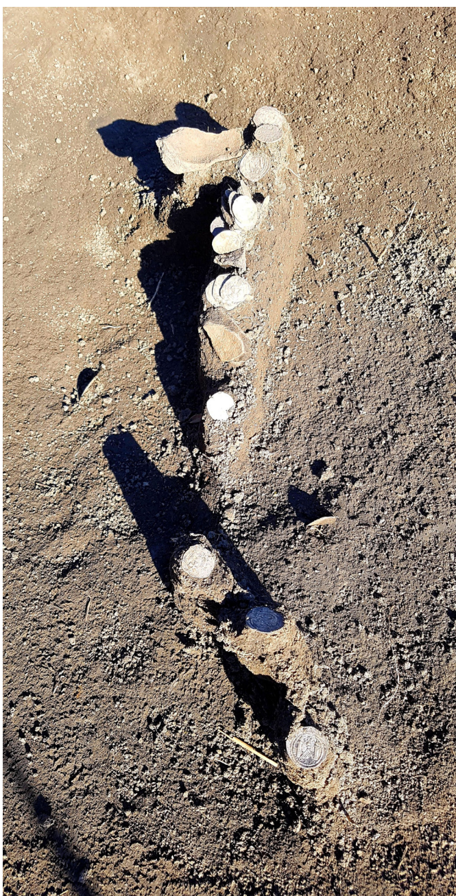
3. kép: A kincslet szétszántott darabjai