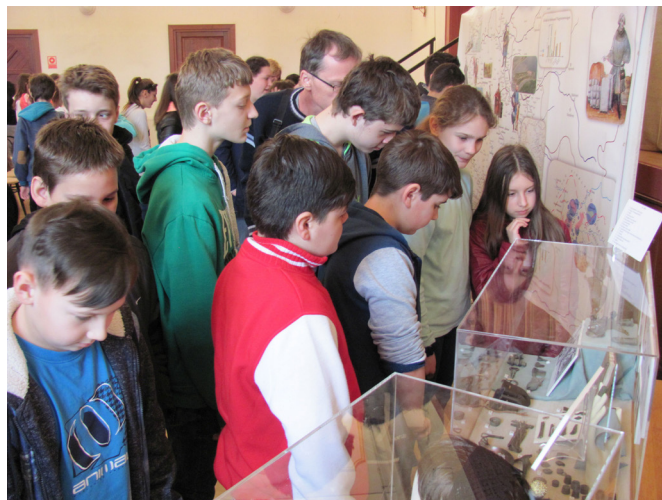
1-2.kép: Iskolások látogatása a kiállításon Battonyán és Csorvason