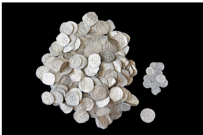
7. kép: A megtisztított érmék