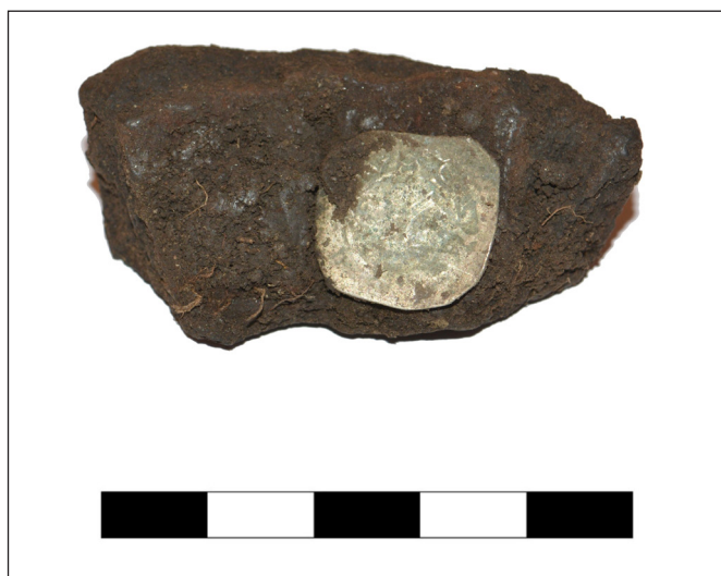
4. kép: Fazékalj töredéke a beleragadt friesachi dénárral