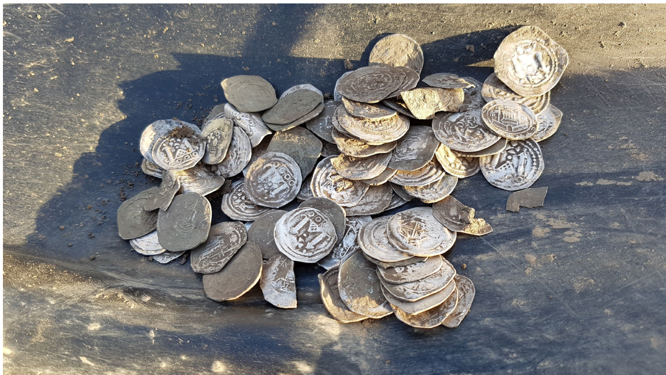
6. kép: Friesachi denárok előkerülésük után