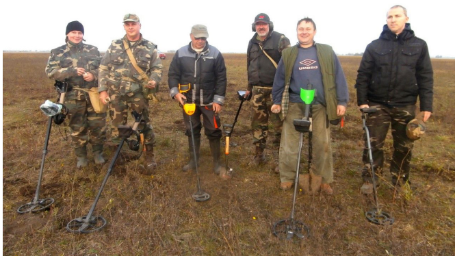
1. kép: A kutatásban résztvevő fémkeresős csapat egy csoportja