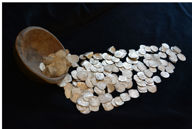
8. kép: Fazék aljtöredéke és az előkerült érmék