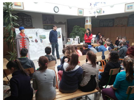
4-5-6. kép: A kiállítás Orosházán, Pusztaföldváron és Székkutason