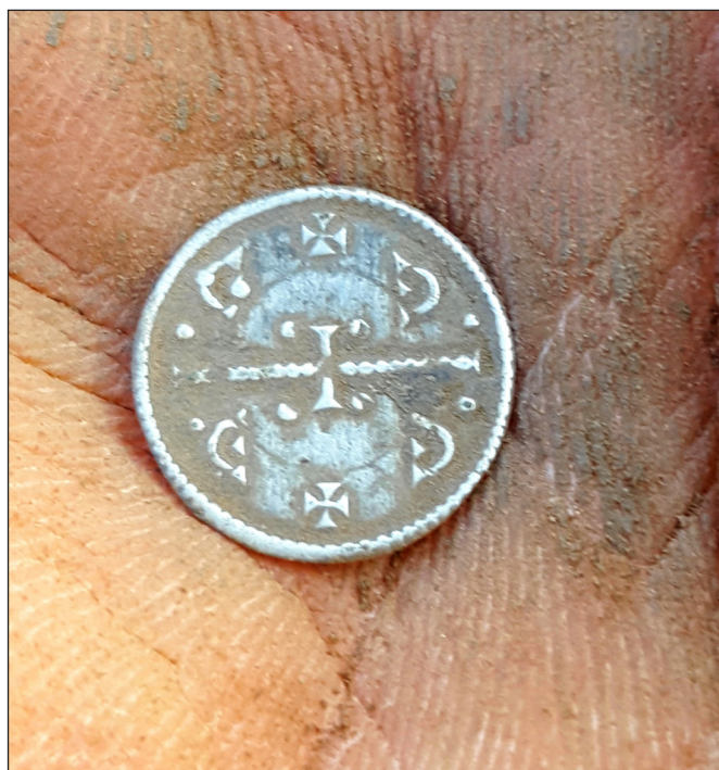
5. kép: II. Géza ezüstpénze az előkerüléskor