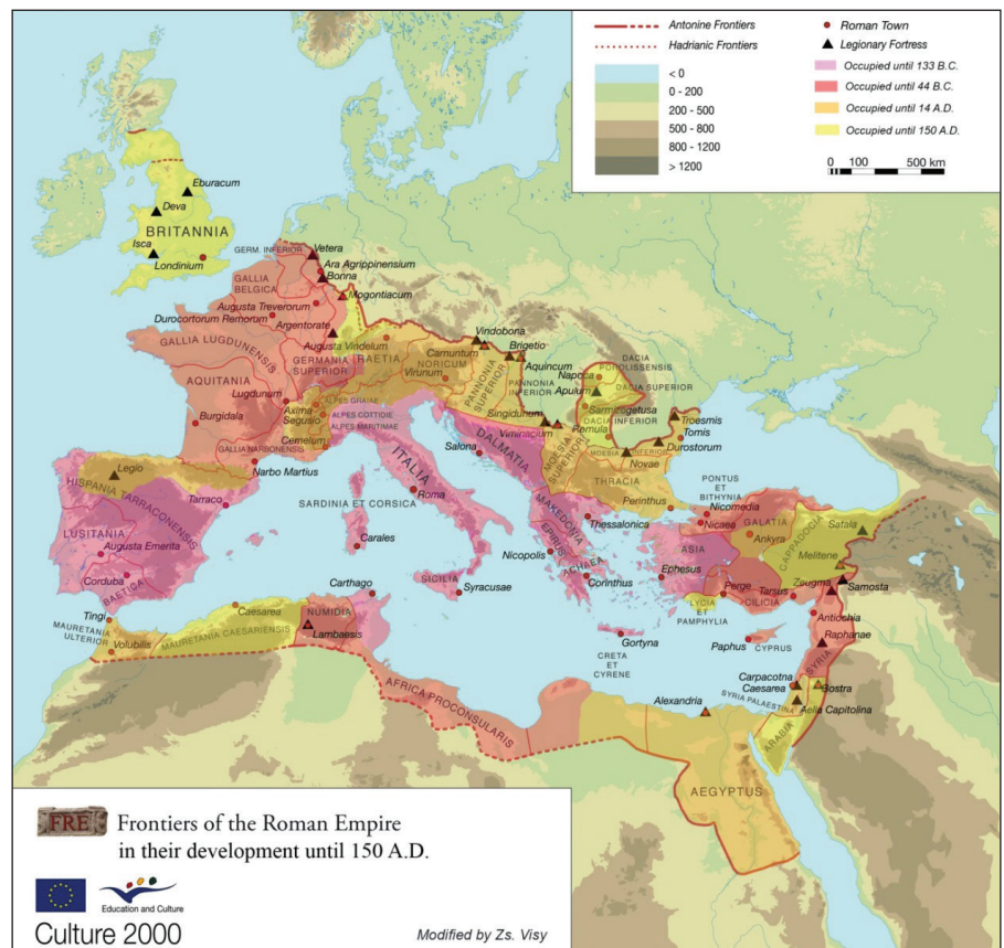
1. kép: A Római Birodalom határai

A hazai előkészületek közül nagy jelentőségük volt azoknak az EU finanszírozta nemzetközi projekteknek, amelyekben magyar részről 2005–2008 között a Pécsi Tudományegyetem Régészet Tanszéke, 2009–2011 között mellette a paksi Városi múzeum és a Kulturális Örökségvédelmi Hivatal vett részt. Ezek célja a Duna mentén húzódó egykori római hadiút nyomvonalának és a környezetében található katonai objektumok – római katonai táborok, bal és jobb parti erődítmények, katonai települések, őrtornyok és más, a