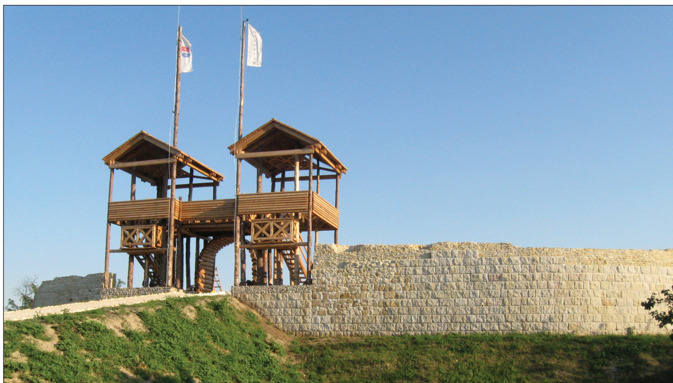
3. kép: Paks-Dunakömlőd-Sánc-hegy, az északi erőd fal és a kaputorony jelzesszerű rekonstrukciója