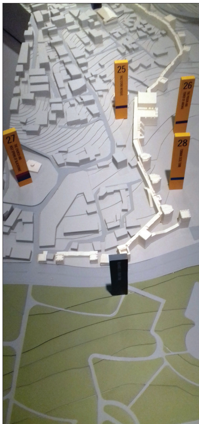
1. kép: A fal makettje (ANAMED, Fotó: Sággy Marianne)

Bár a theodosiusi városfal 1985 óta az isztambuli történeti városmag részeként UNESCO világörökségi helyszín, 2008-ben felkerült a világ legveszélyeztetettebb műemlékeinek listájára, mert a város növekedésével összefüggő építkezési láz és a gondatlan helyreállítás egyaránt hatalmas károkat okozott benne. A restaurálás hibáira az 1999-es földrengés derített látványosan fényt: az oda nem illő, hitvány anyagból készült új kiegészítések mind ledőltek, míg az 1600 éves eredeti falak meg sem moccantak. Az ingatlancámpákat és a mai isztambuliak jórészét (anatóliai beköltözők, szír és afrikai menekültek) nem érdeklik ezek a falak: semmit