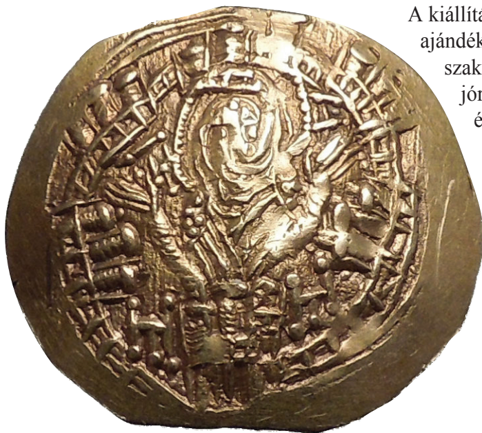
6. kép: VIII. Palaiologosz Mihály hiperperionja, Theotokosz és a falak (ANAMED)

A kiállítás szövegei informatívak. Egy bibliográfiával is megajándékozzák a látogatót (amelyen sajnos a források és a szakirodalom nincs elkülönítve, és a modern szakirodalom jórészt törökül szerepel). Nagyon hiányoznak a térképek és a tárgyak fotói – a theodosiusi fal feliratának egy része, az Aranykapu szobrai mind megvannak az iztambuli Régészeti Múzeumban, érdemes lett volna arrafelé is irányítani az érdeklődőket. A paradoxon abban rejlik, hogy a szövegek túlsúlya miatt rendkívül intellektuális a mustra, a kérdésfelvetés azonban a nagyobb közönséget célozza meg, és a múlt századi fotók is a könnyebb befogadást segítik. A kiállítás a bizantinológia legújabb problematikáját, a „térbeli fordulatot” ( spatial turn ) 1 illusztrálja kitűnően, hiszen a térbeli falból is szöveget csinál, és a szöveg idézi fel a térbeliséget számunkra. De eszünkbe juttatja a 19. században lerombolt európai városfalak kérdését is: ma Róma, Nürnberg, Ferrara és még néhány helység kivételével nagyon kevés városfal áll. Milyen volt Pá-