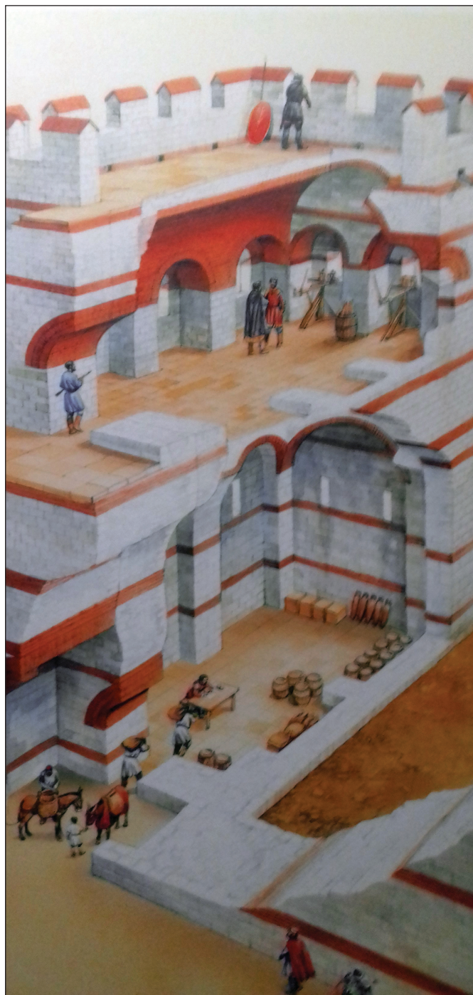
4. kép: A fal szerkezete

Története során a falat földrengések és a Lükosz-folyó áradásai veszélyeztették. Számtalanszor restaurálták, erről írásos emlékek maradtak fenn. A fal ellenőrzése és fenntartási munkálatainak vezetése a Fal Grófjának ( Δομέστικος/Κόμης τῶν τειχέων ) hivatala volt, aki feladatát a lakosok bevonásával végezte. Az