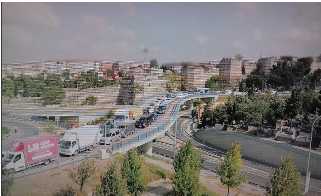
2. kép: A fal ma, autópályákkal körbeépítve