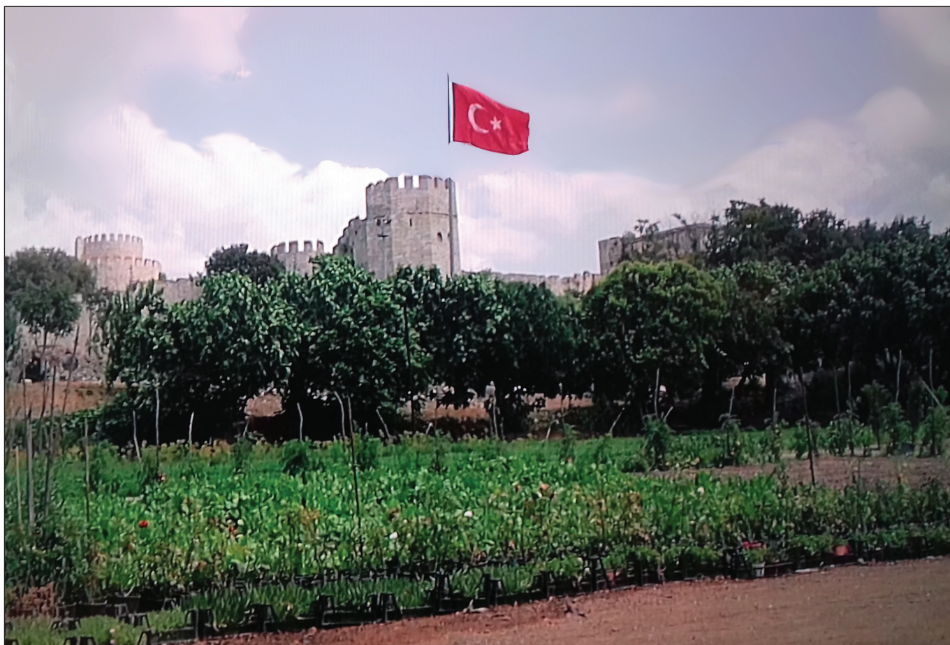
3. kép: A fal menti konyhakertek ma