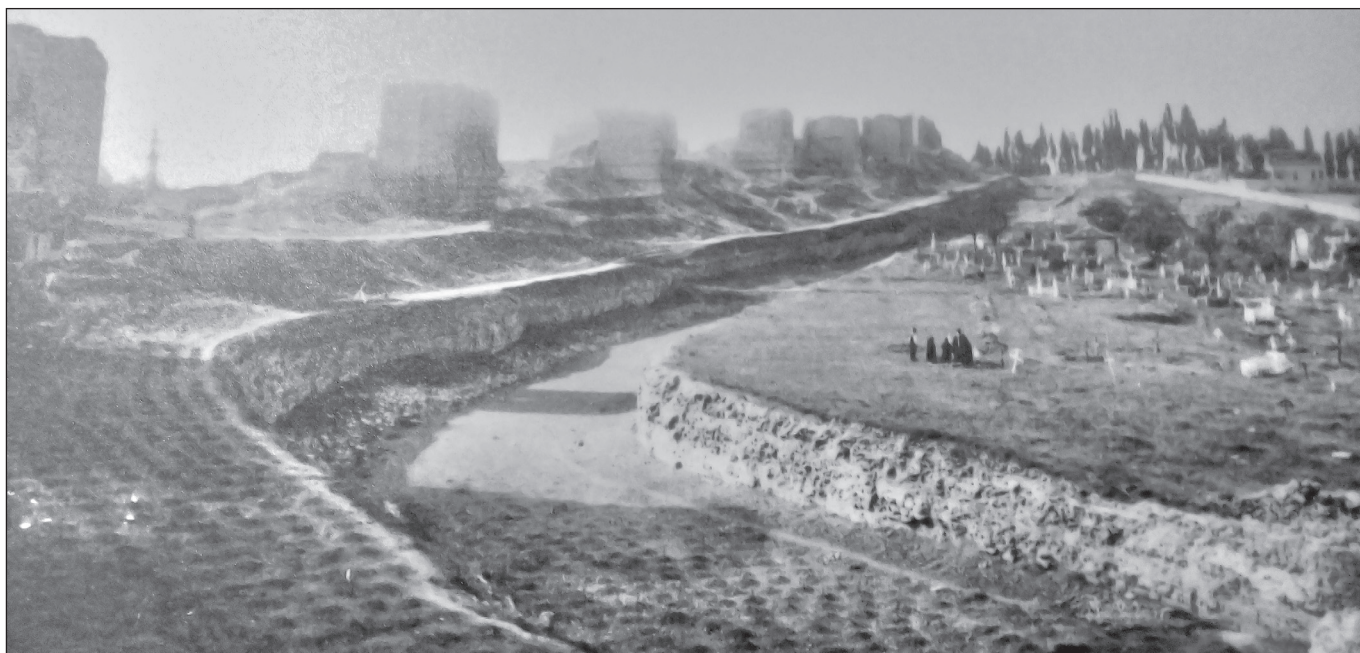
7. kép: A görög temető (ANAMED, Fotó: Sághy Marianne)

A kiállítás a Koç Egyetem Kisázsiai Civilizációk Kutatóközpontjában (ANAMED) látható. A 2005-ben alapított ANAMED a Vehbi Koç Alapítvány nemzetközi kulturális intézete Kisázsia egész történetét felöleli a kezdetektől az Oszmán Birodalmon át a mai napig, és nemcsak régészettel, történelemmel és antropológiával, de kulturális örökségvédelemmel és múzeumszervezéssel is foglalkozik. Köszönöm az ANAMED ösztöndíját, mely lehetővé tette e gondolatébresztő kiállítás megtekintését.