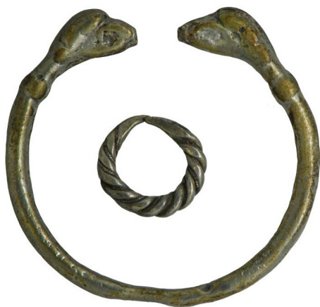
2. kép: Állatfejes karperec és fonott gyűrű Somogyjádról

ismerünk a 10–11. századból. Az utóbbi 20-30 évben a nagyberuházásokat megelőző és más jellegű leletmentő feltárásokból olyan temetők illetve magányos sírok kerültek napvilágra, melyek a fentebb vázolt képet alapjaiban módosították.