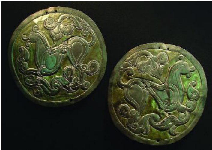
11. kép: Hajfonatkorong Balatonújlak-Erdő-dűlő 15. sírjából (Langó–Siklósi 2013, 143. 8. kép nyomán)

tucatnyi lelőhelyről, szórvány leletről és egyéb információról kell még a kutatásunk során eldönteni azok hitelességét. Amíg ez meg nem történik, és a teljes anyagot közre nem adjuk a corpus kötetben, addig