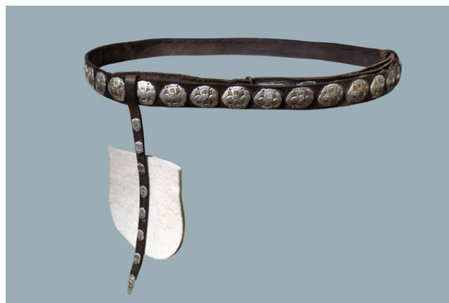
7. kép: A fonyódi öv rekonstrukciója