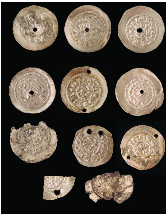
12. kép: Ezüstpénzek Balatonújlak-Erdő-dűlő temetőjéből (Langó–Siklósi 2013, 148. 13. kép nyomán)