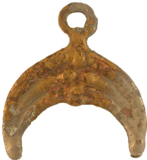
10. kép: Ónozott bronz lunula Vörs-Majori-dűlőből, 396. sír (Hegyi 2015. nyomán)

Legutóbb Balatonújlakon került elő gazdag temető 17 sírral Siklósi Zsuzsannának az M7-es autópálya építését megelőző ásatásából. Részleges és jelképes lovas temetkezések, hajfonatkorongpárok (11. kép), aranyozott ezüst veretek, rozetták, ezüstpénzek (12. kép), ezüstveretekkel díszített nyereg (!) (13. kép) van a leletanyag darabjai között. 26