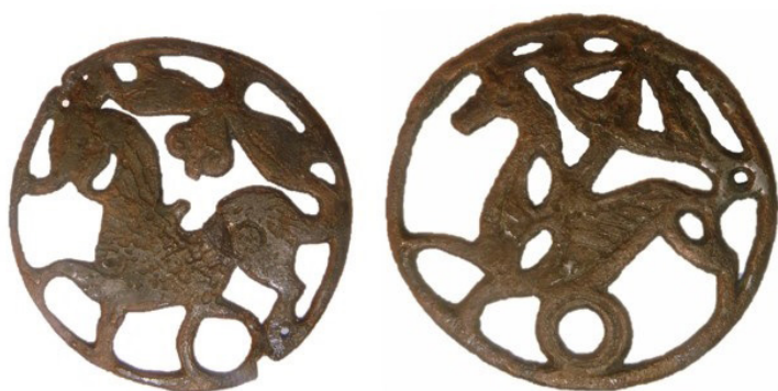
8. kép: Hajfonatkorong pár Vörs-Majori-dűlőből, 208. sír (Hegyi 2015. nyomán)

jesen feltártnak tekinthető, ahol 204 sír, 22 míg a Kaposvár-kertészeti temetőben eddig 315 sír került feltárássra. 23 Szintén ide sorolható Költő László feltárása 2006-ban Zamárdi-Endrédi úti betonkeverő üzem lelőhelyen, vagy Skriba Péter feltárása Somogyaszaló (Mernye)-Nagy-árok lelőhelyen 2008-ban. 24 Kissé rendhagyó, mivel nem a nagyberuházás, hanem a leletmentés kategóriájába sorolható szintén Költő László feltárása 1999 és 2002 között Vörs-Majori-dűlőben . A 10. század közepétől a 11. század első harmadáig-közepéig keltezhető temető különlegessége a teljes feltártság, valamint többek között fegyveres sírjai, és a 208. sír áttört bronz hajfonatkorongjai (8. kép), melyhez hasonló típusú tárgyat a Dunántúlról csak egy lelőhelyről ismerünk (Győr-Malomszéki-dűlő). 25