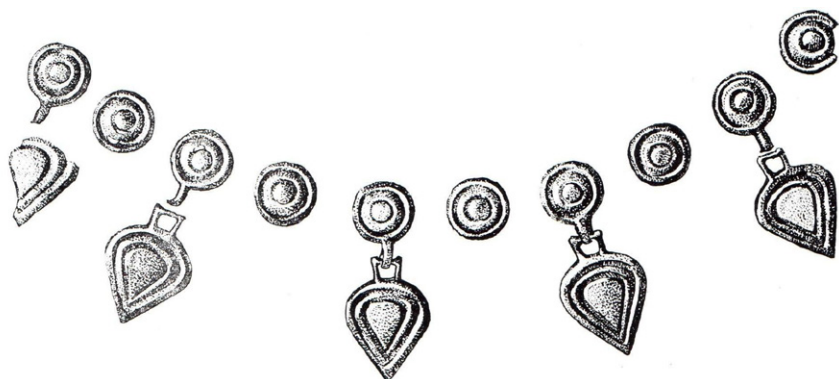
4. kép: Ruhadíszek Törökkoppányból (Bakay Kornél: A Somogy megyei múzeumi szervezet tevékenysége 1974. január 1-től 1975. december 31-ig. Somogyi Múzeumok Közleményei 2 (1975), 307. 77. kép nyomán )