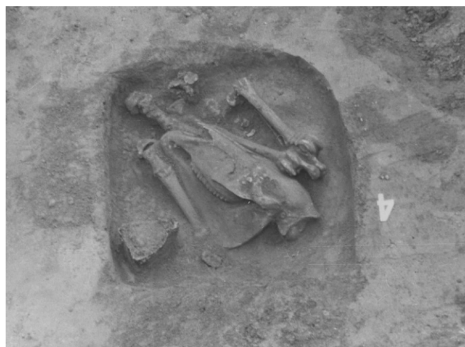
3. kép: Tengőd-Hékútpusztá 4. számú sírja a feltárt lovastemetkezéssel (forrás: RRM Régészeti Adattár I/41/9.)

túlról hiányoztak azok a tárgytipusok, temetkezési szokások, melyek a gazdag társadalmi rétegek jelenlétét igazolták volna a térségben. Ez alatt értendők a fegyveres és a lovas temetkezések, valamint a gazdag társadalmi helyzetre utaló tarsolylemezek, hajfonatkorongok. Ugyanezek az ország többi részén (elsősorban a Felső-Tisza-vidéken vagy a Duna-Tisza közén) sokkal nagyobb arányban fordultak elő. Ugyanakkor a „köznépnek” nevezett temetők is fordított arányban jelentek meg a két tájegységen: az Alföldön elvétve, a Dunántúlon pedig sorra kerültek elő a kiugróan nagy sírszámú, szegényes leletekkel ellátott temetők (Majs, Fiad-Képuszta, Halimba). A magyar középkor kutatói az 1970-es évek elején találkoztak Nagyvázszyban 13 egy néhány napos konferencia erejéig, ahol Kiss Attila mutatott rá a majsai temetőben tett megfigyelési nyomán a dunántúli anyag e fogyatékoságára. Mindez nem jelenti azt, hogy Somogy megye területén kizárólag nagy sírszámú, szegényes leletanyaggal jellemezhető temetőket