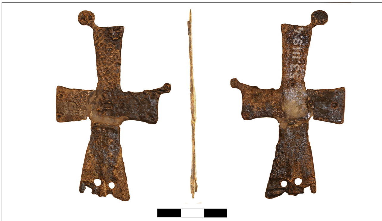
► 1. kép. A Tiszakeszi-Szódadomb lelőhelyen előkerült mellkereszt