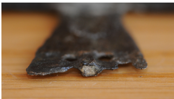
► 2. kép. A mellkereszt letört végének közeli fényképe

A bronzból készített, 7,72 cm magas és 4,78 széles kereszt jelen állapotában rossz megtartású, törött. 3 Utólag restaurálták és legalább négy darabból ragasztották össze. A keresztoszárakon eredetileg egy vékony, 0,4 cm hosszú pálcikatagon keresztül ovális díszítések csatlakoztak a kereszt-hez, ezek a felső- és a jobboldali keresztoszár egy-