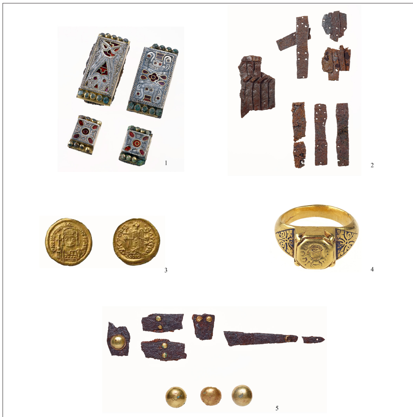
2. kép. Válogatás a bislich-i sír leleteiből. (eltérő méretarány)