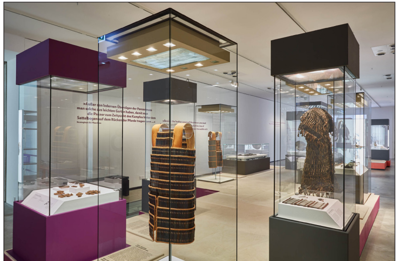
1. kép. A kiállítás belső tere

Nagy feladatra vállalkozott a bonni LVR-Landesmuseum csapata 2021-ben, amikor elkezdték a „Das Leben des BODI: Eine Forschungsreise ins frühe Mittelalter” (BODI élete: Kutatóút a kora középkorba) című kiállítás tervezését, amit egy kiemelkedő leletanyaggal rendelkező temetkezés köré építettek fel. A 2023 márciusában megnyílt kiállítás központi témája a kora középkori elit reprezentációja, illetve az ehhez kapcsolható temetkezések és tárgyak (1. kép). Ezek közé tartoznak a fémlemezekből (lamellákból) készített páncélok, amelyek Európa különböző részein a korszak számos temetkezésében előfordulnak. Hasonló páncélok az avar kori emléktanyagban is megtalálhatók; közülük is kiemelkedik a 2019-ben Derecske-Bikás-dűlő lelőhelyen talált sír lelete. A kiállításnak a Magyar Nemzeti Múzeum gyűjteményében található, Kölked-Feketekapu B és Kiskörös-Vágóhid lelőhelyekről előkerült páncélrészletek is részét képezik. Írásunk röviden összefoglalja a lamellás páncélok temetkezési szokásokban betöltött szerepének rövid kutatástörténetét és értelmezésük lehetőségeit.