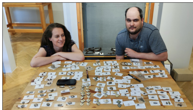
3. kép. Leletek válogatása az installációkhoz

tesek országszerte vettek részt közösségi régészeti projektekben, illetve intézményünk több múzeummal is folytatott sikeres közös munkát. Az országos szintű együttműködés eredményeit olyan emblemikus helyekről származó leletekkel illusztráljuk, mint például a muhi csatátér. Egy látványos installáció keretein belül látható a több ezres darabszámú érmét magába foglaló késő középkori, kora újkori érdei kincslet. A kiállítás nem kerül meg a vegyes megítélésű fémkeresőzés problémáit, és az összetett társadalmi jelenség árnyaltabb megközelítésére tesz kísérletet. Különösen gazdag interpretálási lehetőségeket kínálnak a múzeumbarát, etikus fémkeresőzés során megtalált fémleletek és a megtalálásukhoz kapcsolódó történetek. A beszolgáltatott fémtárgyakat egy látványraktár sémájára berendezett térben mutatjuk be.