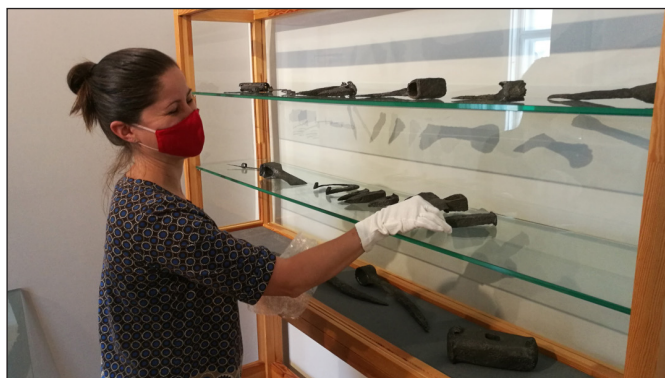
2. kép. Leletek elhelyezése a vitrinben