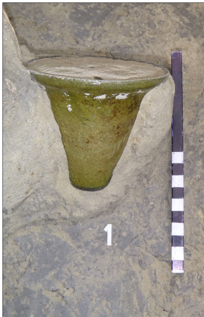
2. kép. Kora népvándorláskori körárkos temetkezésből előkerült üvegpohár (Dunaszentgyörgy, Malom út; fotó: Salisbury Kft.)

Paks, Új-Birinyó 1. lelőhelyen (ásatásvezető: K. Németh András, feltárt pozitív felület: 20.000 m 2 ) egy több hektáros középkori település – Szentmiklós/Csámpaszentmiklós (K. NÉMETH 2015, 136) – észak-déli tengelyében közel 500 méter hosszan tártuk fel a nyomvonalba eső területet. Munkánk nyomán egyértelművé vált, hogy az Árpád-korban (talán épp a tatárjárással) elpusztult falu később újratelepült ugyan, de a 15. század végére már ismét elhagyták lakói. A szokásos telepjelölések közül említésre méltó az északi negyedben előkerült, és a falu második horizontjára datálható több, jelentősebb méretű gerendaszerkezetű ház és egy nagyobb lejáratos pince. A középkori falu részleges felülrétegzettsége mellett a feltárást