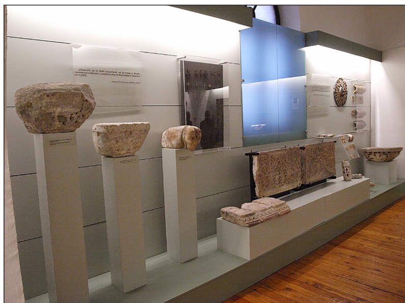
3. kép. Középkori leletek Veliki Preszlavból a Szófiai Régészeti Múzeumban.

A XX. század elején fokozatosan alakult ki a múzeumi hálózat, országszerte folytak a múzeumalapítások, mind központi, mind helyi intézmények létrejöttével. Az I. világháború több évre megszakította az országos ásatások lehetőségét, majd a két világháború között számos projektet indítottak (Madara, Veliki Preszlav, Pliszka) (3. kép). Az 1944-es bombázás következtében a múzeum épülete súlyosan megsérült, részben leégett. A felújítások során az intézményt strukturálisan is átszervezték. 1948-ban a Művészeti Főosztály kivált és ezzel létrejött a Művészeti Galéria, a Régészeti Társaság pedig beintegrálódott a Bolgár Tudományos Akadémiába. A II. világháborútól napjainkig intenzívebbé váltak a feltárások és felmérések, és a kutatásokból származó tanulmányok száma is megnövekedett.