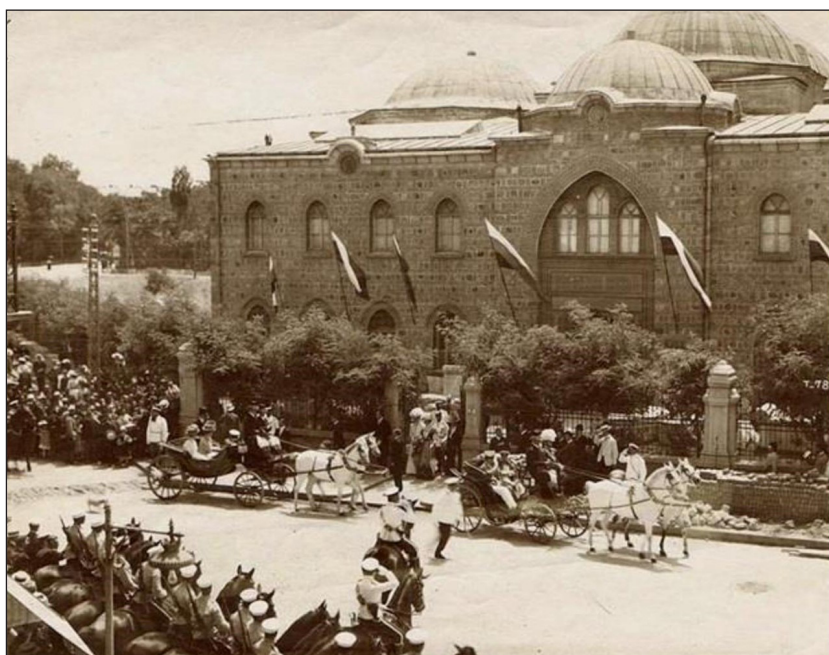
1. kép. A Régészeti Múzeum 1905. május 18-i megnyitója (Ivanova, 2017).

Az újonnan felállt kulturális kormányzat átépítésekbe kezdett és új funkciókkal látta el a török idők átveszelő műemlékeit, pl. 1892-ben, amikor a Nemzeti Múzeum különvált a könyvtártól és a korábbi Bűyük mecsetbe költözött át (1. kép). 2 A múzeum alapgyűjteménye 343 db régészeti és néprajzi tárgyból, valamint 2357 db antik érméből állt, így a kezdeti feladatok között szerepelt további emlékek összegyűjtése; ehhez jelentős közigazgatási, katonai, iskolai és egyházi hatósági segítséget kapott a múzeum. Az épület felújítására 1892-ben 65 ezer, két évvel később 40 ezer levát költöttek, mert sem kiállítások rendezésére, sem a látogatók fogadására nem volt alkalmas; az egykori mecset három falához új épületeket húztak fel. 1905. május 18-án Ferdinánd herceg jelenlétében nyitották meg a múzeumot (1. kép) mely 1893. január 1-jével vált hivatalosan független kutatóintézeté saját költségvetéssel (2. kép). Az 1909-ben elfogadott közoktatási törvény elfogadta a Nemzeti Régészeti Múzeum kiválását és önállóságát, illetve ideiglenes szabályait. A törvény