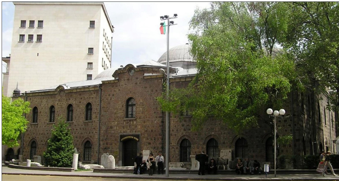
2. kép. A Régészeti Múzeum Szófiában

374. cikkelye rendelkezett a bolgár régiségek külföldről való visszaszolgáltatásáról, a 379. cikkely pedig felállította a múzeum struktúráját és négy főosztályát: az Őskori, Középkori, Numizmatikai és Művészeti Osztályokat.