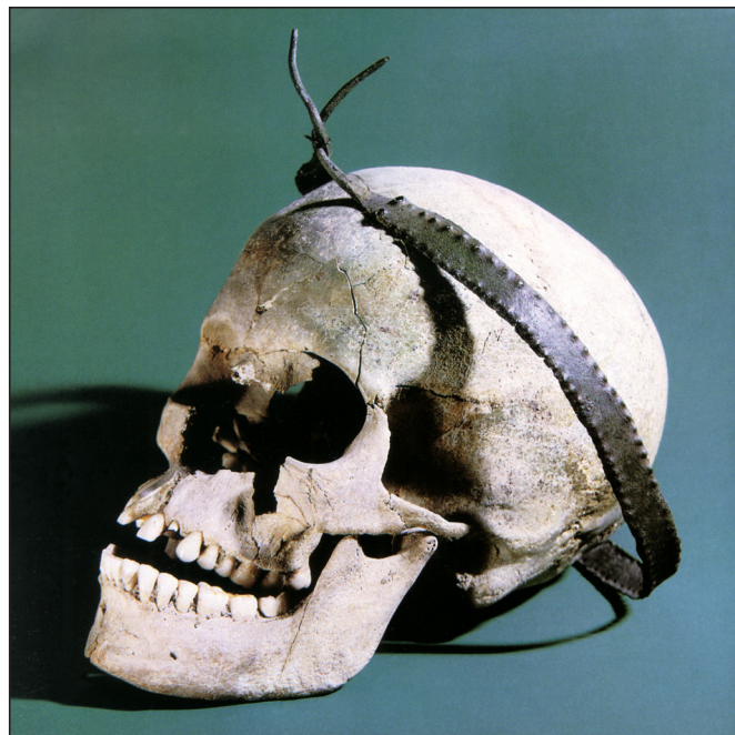
3. kép: A vörsi diadém.

és került elő a mindmáig egyedülálló vörsi sír, a halott fején a rézdiadémmal (3. kép). 14 1956-ban látott napvilágot a badeni kultúra monográfiája, 15 amelyben Banner János mindössze néhány, zömében amatőrök által feltárt lelőhely ismeretében elemezte a temetkezéseket, köztük a mindmáig legnagyobb budakalászi temető első 110 sírját. 1958-ban Kalicz Nándor leletmentésén, Centeren kerültek elő azok az ember alakú urnák, amelyek évtizedekig fogódzópontot jelentettek a Kárpát-medence és Trója kronológiájának összekapcsolásához, 16 bár ma már tudjuk, hogy a trójai település Kr. e. 3500-3000 között még nem is létezett. 1958-1962 között a mezőcsáti kettős rítusú temető feltárására került sor. 17 A következő három évtizedben Pilismarót–Basaharcon, 18 Szigetszentmártonban (1972), 19 Balatonbogláron (1980, tömegsír) 20 kerültek elő különlegesen érdekes temetkezések. A modern nagyberuházásokhoz kapcsolódó, nagyfelületű ásatások legfőbb eredménye témánk szempontjából, hogy ugrásszerűen megnövekedett az ismert, telepödrökben talált emberi temetkezések száma. 21 Ezen kívül csak néhány sírt említenek az előzetes közlemények, önálló temető csak Balatonlelle–Felső-Gamászon került elő (2002). 22 Hasonló a helyzet a szomszédos országokban is.