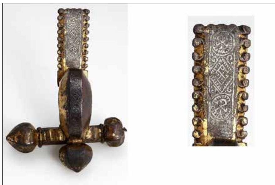
1. kép: Krisztus-monogrammal díszített hagymafejes fibula, Ságvár; késő római temető, 20. sír.

1. ábra: Szimbólumok megjelenése és száma a pannoniai hagymafejes fibulákon