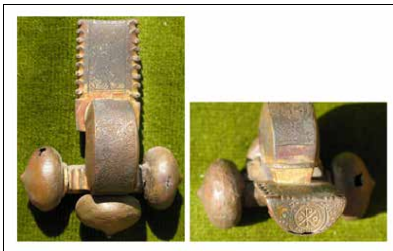
4. kép: Koszoruban ábrázolt Krisztus-monogrammal díszített hagymafejes fibula, Bátaszék-Kövesdpuszta, késő római temető, 108. sír

A ságvári késő római temető 7. sírjából a férfi csontváz jobb combja alól került elő egy lemezből készült, aranyozott fibula, mely a vizsgált pannoniai anyagban egyedülként már a Keller/Pröttel 6. típusba sorolható. Az épített, téglákkal fedett sírban a fibulán kívül mellékletként a láb környékén két üvegedényt, a medence tájékán egy ezüstből készült övcsatot, egy ugyancsak ezüst szíjvéget és egy ismeretlen rendeltetésű vastárgyat 29 helyeztek el. A két, rendkívül töredékes állapotú üvegedény közül az egyik feltételezhe-