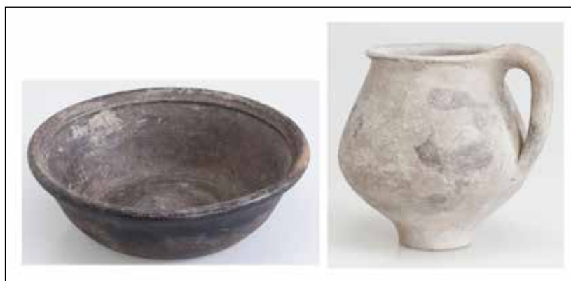
3. kép: A tihany-sajkódi sír kerámiamellékletei

A vizsgált 5. típusú fibulák lelőköri körülményeiről nincs minden esetben adatunk. A győri példányt 1953-ban ismeretlen lelőhelyüként leltározták be, Szőnyi Eszter felvetése szerint a korábban feltárt késő római temető lehetett a tárgy eredeti lelőhelye. 21 A sirmiumi darab töredékét 2005-ben a császári palota területén, az előző évi ásatás törmelékanyagában találták, így eredeti kontextusa nem rekonstruálható 22 (3. kép). A mursai fibula 1934-ben építési munkálatok során került napvilágra a város észak-nyugati területén. 23 A neviudunumi 24 és a somlóvásárhelyi 25 darabok szórványleletként kerültek elő, pontos lelőhelyük ismeretlen.