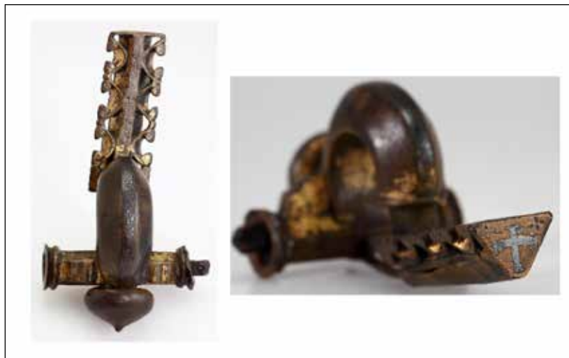
2. kép: Szaurogram mal díszített hagymafejes fibula, Ságvár, késő római temető, 7. sír

A vizsgált fibulákon három esetben ábrázolták a görög alphát és oméगत , két esetben szaurogram mal, egy alkalommal pedig Krisztus-monogrammal kombinálva. Az alpha és oméगत betűk mint a kezdet és a vég szimbólumai 15 ugyancsak Jézus Krisztusra utalnak. Az apokaliptikus betűk kombinációja az ókeresztény képzőművészetben az ariánusok elleni harc és az azt követő győzelem alatt élte virágkorát, ahol az Atya és a Fiú egylényegűségére utalhatott. 16 Az éremverésben először Magnentius 353-as veretein ábrázolták Krisztus-monogrammal együtt. 17