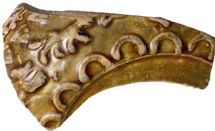
10. kép: Mázás, reliefdíszes tál töredéke a hulladékgyűjtőből