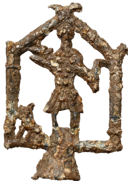
11. kép: Silvanus istent ábrázoló ólom votív (fogadalmi tárgy) a hulladékgyűjtő környezetéből

téglákból áll. Ez részben a szomszédos (a szakirodalomban „gázgyári” néven ismert) fazekastelepről, 17 részben pedig a közelben kialakított mészégető kemencékből származhatott. A gödör eredeti funkciója esetleg más is lehetett: veremház vagy például műhely is. Erre utalt az objektum szélén lévő néhány cölöplyuk, illetve a beásás alján talált köves sáv, ugyanakkor egyéb, házra utaló nyomot (padlószint maradványait vagy kemencét) nem találtunk.