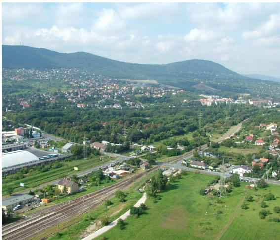
6. kép: A vasút Aranyhegyi-patak menti temetőn és a villaövezeten áthaladó szakasza

Láng Orsolya • Az aquincumi polgárváros keleti védművei: válasz egy évszázados kérdésre