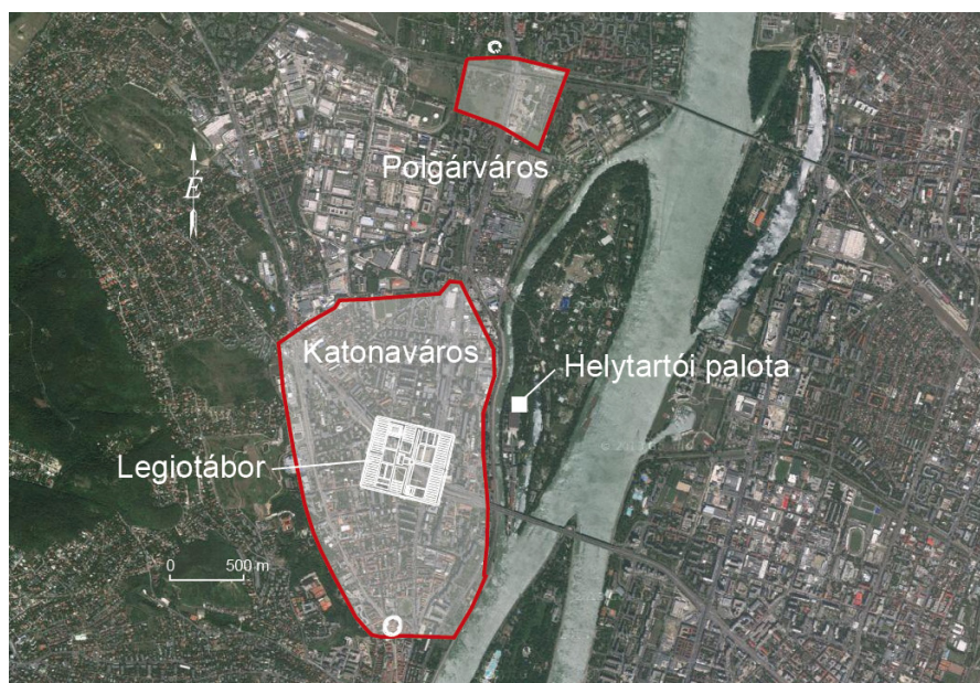
1. kép: Az aquincumi településeggyüttes topográfiai helyzete