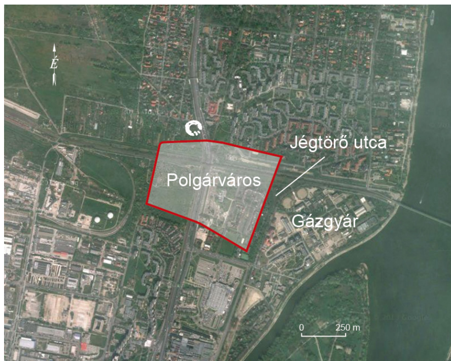
3. kép: Az aquincumi polgárváros és a modern város viszonya (BTM Aquincumi Múzeum, Rajztár)