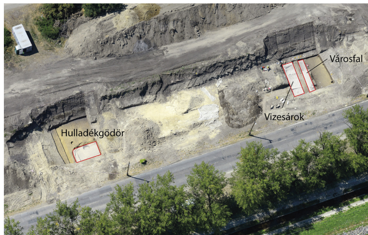
7. kép: A vasúti töltésben megnyitott felületek a római kori emlékekkel (grafika: Kolozsvári Krisztián)