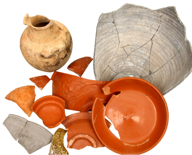
9. kép: Leletek a hulladékgyűjtőből

A keleti hídpillér helyén előkerült jelenségek már egyértelműen a város határán kívüli, perifériális területre utalnak. A szelvény északnyugati részén egy nagyméretű (legalább 7×5 méteres), szögletes alaprajzú hulladékgyűjtő részlete került elő. Az átlagosan 1 méter mély gödör nagy mennyiségű római kori leletanyagot tartalmazott: sok, viszonylag ép edényt (korsót, fazekat, terra sigillata edényeket) és állatcsontot. (9. kép) A betöltés felső rétege vörös, átégett kemencehulladékból, illetve rontott