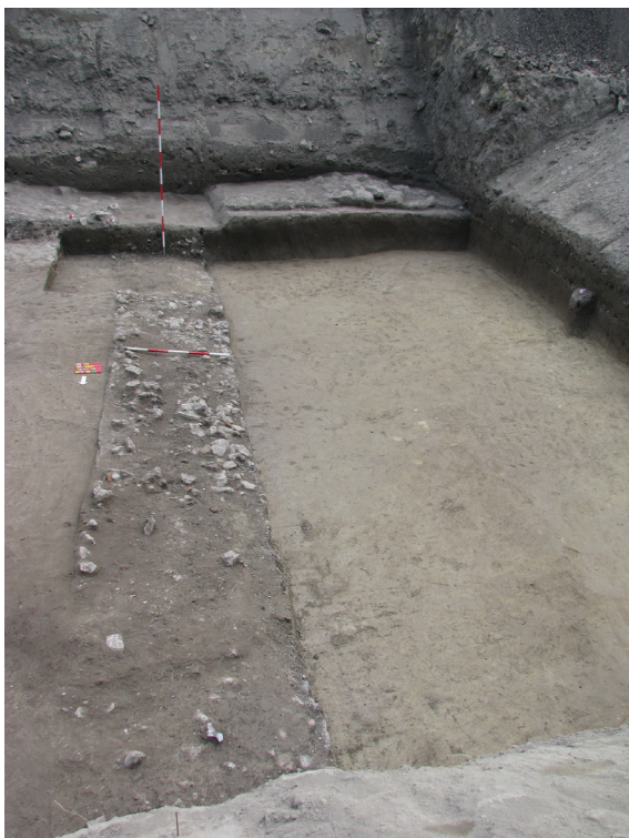
8. kép: A polgárváros keleti városfalának kiszedett vonala a feltárás közben

amely a terület keleti szélén futott, észak–déli irányban. A nagyméretű árok jelentkezési szintjétől számítva legalább 1,6 méter mély volt. Folytatását a fent említett, 2009. évi kutatás során már azonosítottuk. Az árok nyugati oldalán, attól kb. másfél méterre egy azzal párhuzamos, 1,2 méter széles fal futott. A fal köveit kiszedték, csak négyszögletes profilú alapozási árka maradt meg, amely habarcsdarabos, kisköves földdel töltődött fel. Ennek egy részletét is dokumentáltuk 2009-ben. (8. kép) A rétegtani megfigyelések alapján a széles árok és a fal egykorú lehetett. A faltól nyugatra karólyukak sorakoznak, amelyek feltehetően valamely, a falhoz kapcsolódó szerkezet nyomai lehettek. Az ásatási szelvény nyugati szélén egy északkelet–délnyugati irányú földút és az azt kísérő kis vizesárok került elő.