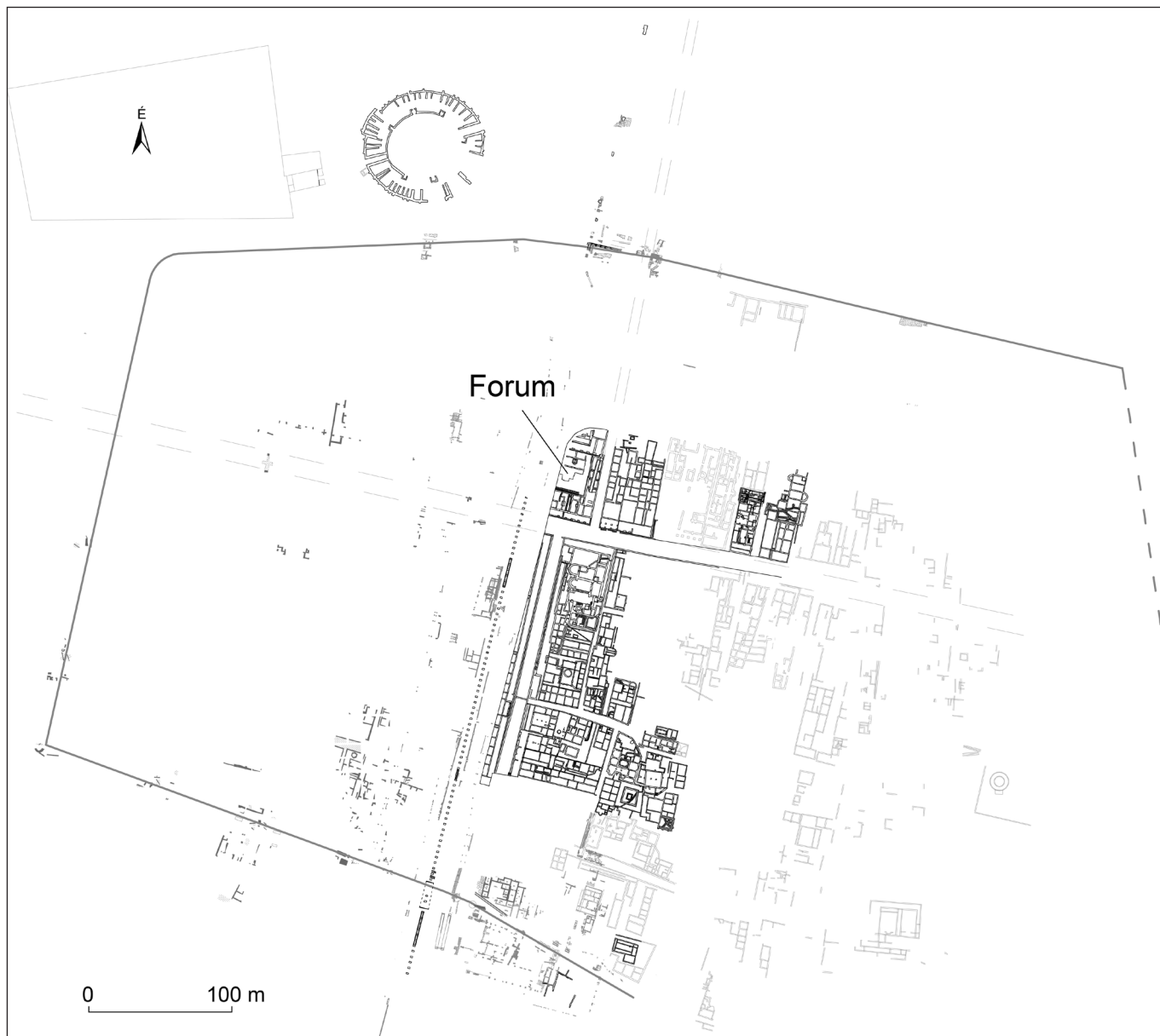
2. kép: Az aquincumi polgárváros alaprajza a feltételezett keleti városfal helyével (szaggatott vonal)

A keleti városfal „hiányának” okát a kutatás – mint később látni fogjuk, helyesen – azzal magyarázta, hogy a terep a római korban nyugat–keleti irányába lejtett, így a városfalmaradványok is mélyebben keresendők, és mély, szondázó jellegű ásatások hiányában eddig nem kerülhettek elő. 3 Mindössze annyit lehetett sejteni, hogy a város határának valahol a Jégtörő utca magasságában kellett húzódnia, hiszen a gázgyári lakótelep alatt Nagy Lajos még lakóházak és utcák maradványait találta, 4 valamint kelet felé egy kisebb szentélykörzetet, amely jelezheti a település szélét. 5 (3. kép)