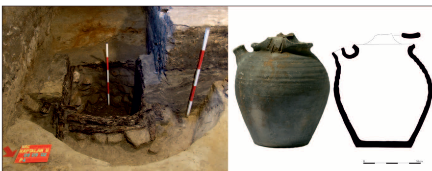
4. kép: A 4. kút aljából nagyobb méretű, 13–14. századi edénytöredékek kerültek elő