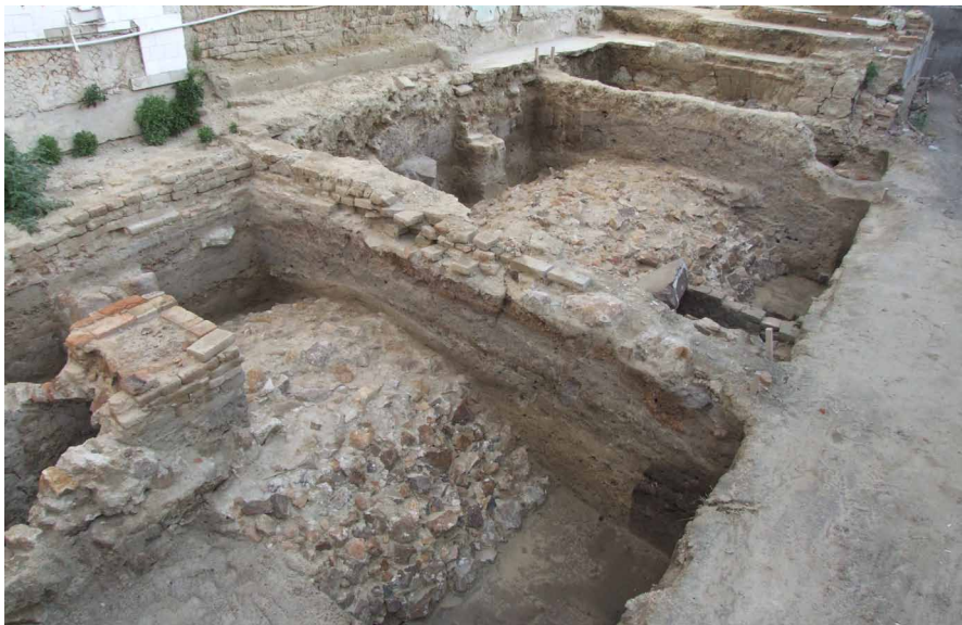
5. kép: A boltozat külső íve fölött nem találtunk falakat vagy konzolokat, melyek egy esetleges lakóház földszinti padozatát tartották volna

mélységben bukkant elő a függőlegesen elhelyezett deszkából kialakított bélés köríve. A jó állapotban megmaradt deszkákat kívül faabroncs fogta össze. A 4. kút korábbi volt a pincénél, betöltése jól láthatóan a fal alapozása alá futott. A mélyre ásott, teknős, kerek gödör alját és oldalát 1 méteres magasságig terméskövekkel rakták ki, majd erre ácsolták a négyszögletes gerendabélést.