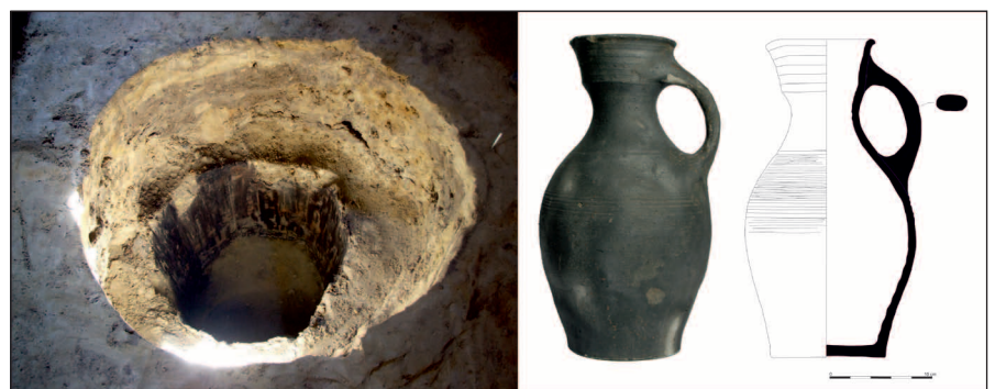
3. kép: A 3. kút a pince építésével egykorú, és valamikor a 17. században temették be. Teljesen ép szürke korsó és 16–17. századi érme került elő belőle

A beltérben összesen öt objektumot bontottunk ki: két kutat és három gödröt. A 3. kút betöltése megegyezett a pince nagy részét kitöltő, koromszemcsés, szürke réteggel. Jelentkezési szintjétől számított 50 cm-es