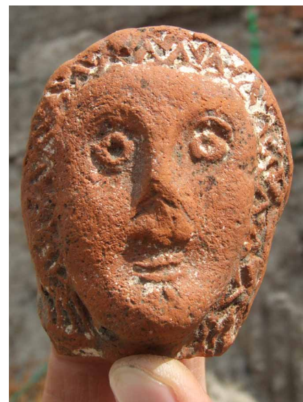
10. kép: Játékbaba festett terrakotta feje egy török kori gödörből