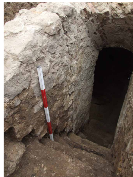
6. kép: A személylejárót a késő középkori ház pusztulása után, valamikor az újkorban téglával falazták el

A kőfal és a pince a 16. századra keltezhető. Először a házat építették meg, majd használatba vétele után egészítették ki a pincével. Ez utóbbi, amennyire a ház alapfalával összehasonlítható volt, magasabb technikai színvonalat képviselt. A pince építését a nagyméretű gödör kiásásával kezdték, majd következtek az oldalfalak és a boltozat. A zárófalak és lejárók az utolsó fázisban készültek el.