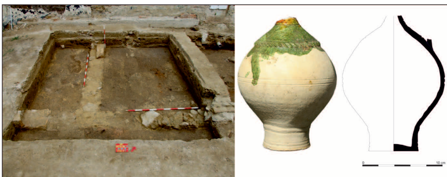
7. kép: A középkori háznak csak az alapozása maradt meg, de a köveket több helyen még ebből is kiszedték