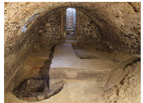
1. kép: A késő középkori pince bontása, előtérben a 4. kút

A kert régészeti jelenségekkel egyenletesen volt fedve, de a tárgyi emlékeket tartalmazó, éremmel datált feltöltések csak a telek közepe táján jelentek meg, kőépítmények pedig csak a telek utcafront felőli végében voltak. A pincét magát a középkor óta nem építették át, az egyetlen módosítás az eredeti építészeti egységen a személylejáró elfalazása volt. A telek hátsó részére nyíló teherlejárón keresztül a pince továbbra is megközelíthető és egészen napjainkig használható maradt. A pince fala és boltozata sima felükkel befelé fordított,