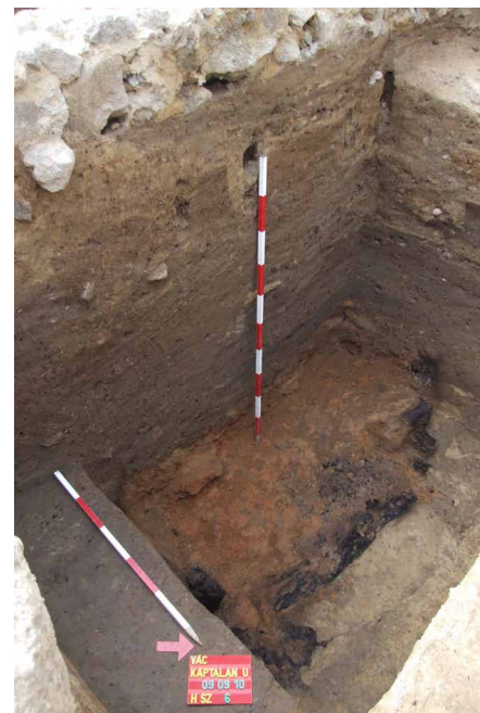
9. kép: A 13. századi faház maradványai több mint 2 méterrel a késő középkori falak alatt kerültek elő

Vác, a Dunakanyar szíve. Történelmi városkalauz helybelieknek és világcsavargóknak . Vác: Vác Város Önkormányzata, 2009.