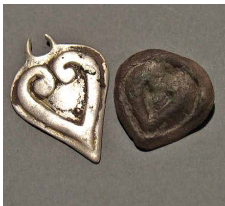
6. kép: A soros rendezésű temető népességének veretei restaurálás előtt