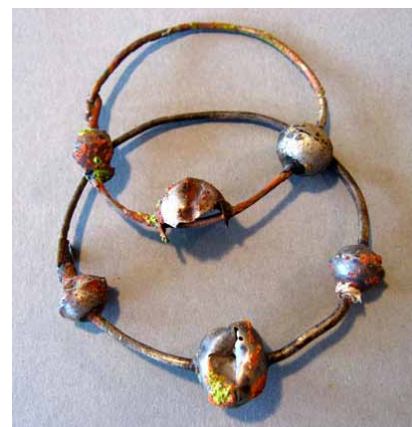
8. kép: Felhúzott gömbös ezüst fülbevaló a kun temetőből restaurálás előtt