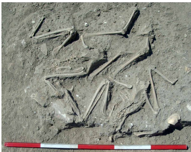
9. kép: Lefejezett szárnyasok a kun szállástemetőből