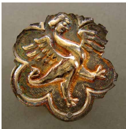
7. kép: Aranyozott ezüst ruhaveret a kun szállástemetőből