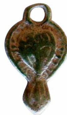
2. kép: Kéttagú veret alsó része restaurálás előtt (soros rendezésű temető népessége)

A fentiekből is érzékelhető, hogy a két temető – a feldolgozás jelen állapota szerint – akár egy időben is használatban lehetett, amellyel, hogy egymásra is rétegződtek. Jelenlegi ismereteink szerint ez szokatlan jelenség a saját korában. A két temetkezési, temetőhasználati mód egyházjogi, elvi megfontolásokból nem lehetne ugyanazon a helyszínen, bár egyre több esetben merül fel a gyanúja az ittenihez hasonló jelenségcsoportnak, ám általában ezek a kis kiterjedés vagy más okok miatt nem, vagy csupán részben vizsgálhatók. 7 Ez a lelőhely az első, amelynél minden kétséget kizáróan azonosítható, vizsgálható és a tudományos kiértékelést követően megítélhető ez a több évtizedes régészeti kutatási-értelmezési probléma.