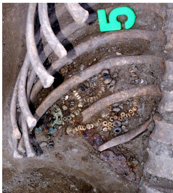
10. kép: Gyönggyel varrott tarsoly a kun szállástemetőből

szerkezet nyomai, valamint az árokból előkerült égett tapasztásomladék egyértelművé teszik, hogy sárral tapasztott falalánkkal vették körbe a templomot az erődárkon belül. Itt kell megjegyezni, hogy az árokkal vagy árkokkal való körbevétel lehetséges, sőt egyes adatok alapján szinte biztos, hogy még az eredeti és nem a kun lakosság tette meg elsőként. A részletes feldolgozás hivatott eldönteni ezt a kérdést is.