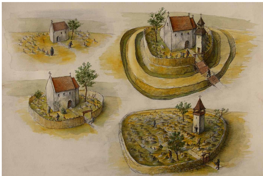
4. kép: Kőnig Frigyes feltárás közti művészi akvarell-rekonstrukciói a templomról és az azt kerítő árkok, erődítés fejlődéséről