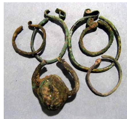
3. kép: S-végű hajkarikák és Árpád-kori felhúzott gömbös fülbevaló/hajkarika az Árpád-kori temetőkből restaurálás előtt