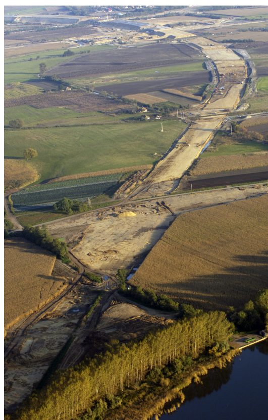
2. kép: Nyíregyháza-Rozsrétszőlő-Szelkő-dűlői lelőhely légifelvételen