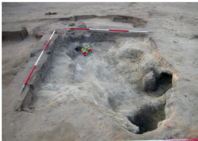
4. kép: Celldömölk-Vulkán-fürdő 83. objektuma, egy külső kemence

Csoportunk több tagja beszámolt már előzetes kutatási eredményeiről a szélesebb szakmai nyilvánosság előtt. A hazai tanácskozások közül a Magyar Nemzeti Múzeumban megrendezett „A cserép igazat mond...” című konferenciát kell kiemelnünk, a nemzetközi fórumok közül pedig a tizedik alkalommal a szlovákiai Szomolányban (Smolenice) megrendezett Rurallia konferenciát említhetjük.