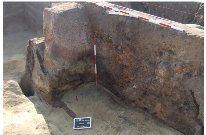
5. kép: A 223. ház részlete az agyagból tapasztott osztófallal, a szemeskályha omladékával és az oldalfal elszenült deszkaborításával

A településrégészeti adatok az esetek nagy részében nem teszik lehetővé társadalomtörténeti kérdések tárgyalását. 3 Kivételes példa a kánai feltárás, ahol a teljes települési egységet (falú, templom, temető) sikerült régészeti módszerekkel vizsgálni, vagy a középkori Szentkirály tervásatása, ahol az aprólékos megfigyelésekre építve nemcsak a település telekszerkezetét lehetett rekonstruálni, hanem részben a faluközösség határhasználati rendjét is. 4 Társadalmi elkülönülést falusias településeken a leletanyag vagy az építészeti megoldások különbségei és a településszerkezet sajátosságai jelezhetnek. Kiváló példa erre a dabasi középkori falu. A pincés, kétosztatú ház és a földbemélyített, szokásos falusi házak egymás melletti és idő-