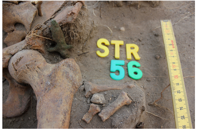
12. kép: A bronzcorpust temetéskor az elhunyt kezébe helyezhették.