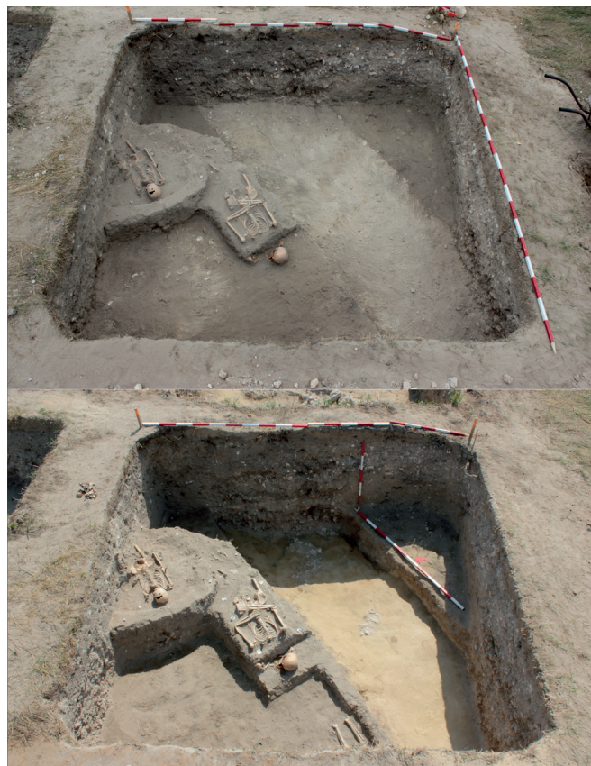
7. kép: Az egykori templom alapozási árka tört köves, homokos-meszes, laza betöltésű, árokszerű beásásként jelent meg szelvényeinkben.

A teljes alaprajz megrajzolásához további kutatásokra van szükség, de a leletek ezúttal sem okoztak csalódást. Egy kisfiú bolygatott csontvázának