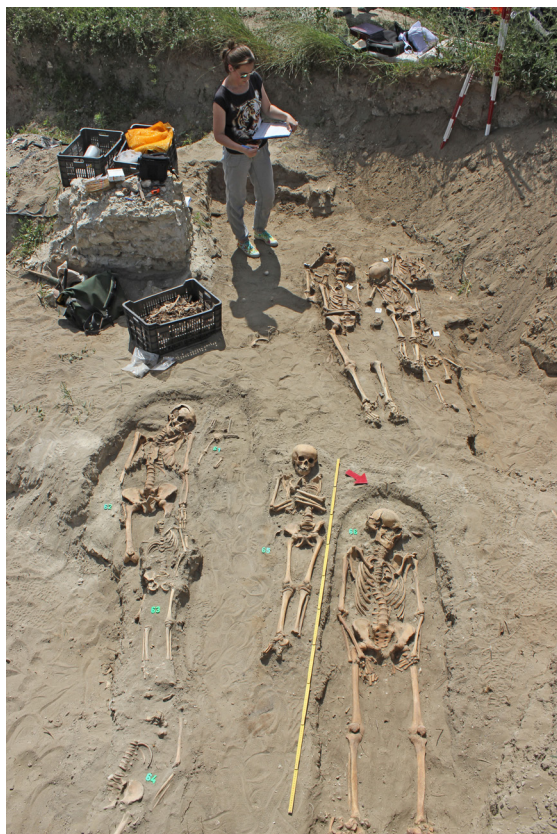
9. kép: A templom körüli temető részlete, háttérben az Árpád-kori templom falcsontjka