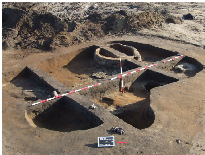
3. kép: Az egyosztatú 270. házban kerek sütőkemencét, tapasztott agyagpadlót, beszakadt gerendamaradványokat és több ép edényt találtunk.