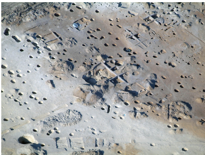
2. kép: A légifelvételen jól megfigyelhető a település szerkezete: fölül az egyosztatú, földbe mélyített házak sora, középen a 223. ház, alul a templom felé vezető út kibontott szakasza.