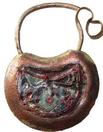
6. kép: Igazi különlegesség az S-végű karikára szerkesztett, rekeszszománcos, aranyozott réz fülbevaló