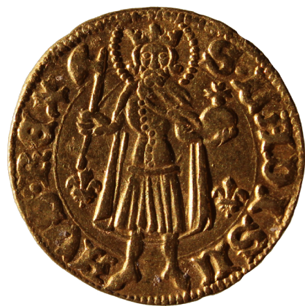
14. kép: A két Luxemburgi Zsigmond aranyforint mellett a templom és temető feltárása során talált szörvány középkori pénzek száma meghaladta a százat.