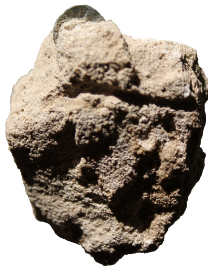
8. kép: Fémkereső műszerrel találtuk meg az egyik vakolattöredékben azt a Zsigmond-kori érmet, mely az alapozásban talált parvussal együtt pontosan datálta a késő középkori templomot.