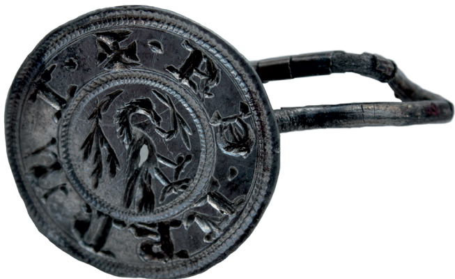
13. kép: A templom körüli temető leggyakoribb leletei a gyűrűk voltak.