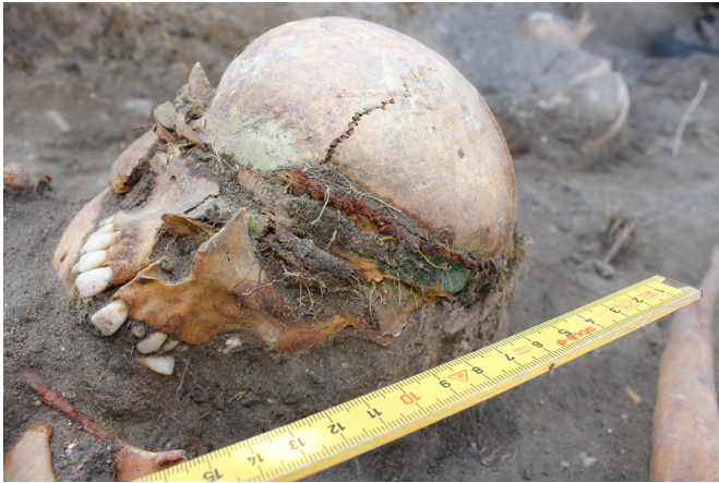
11. kép: A 67. temetkezés pártája