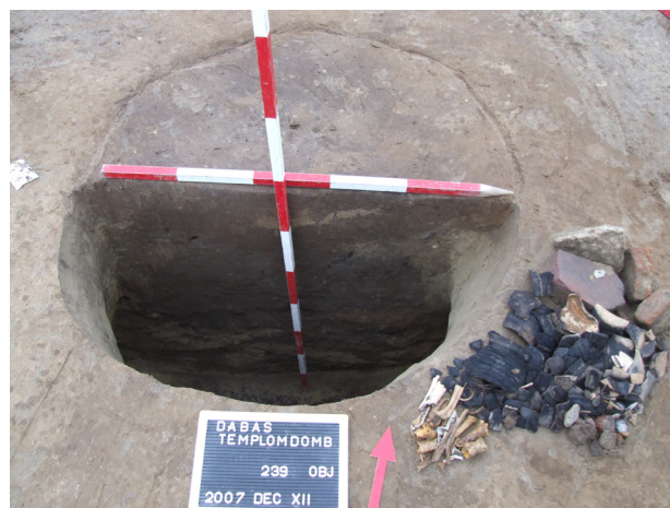
1. kép: A tűzvész előtt terménytárolóként használt méhkasos vermeket a pusztulás emlékeit őrző kormos hamus törmelékkel, paticsal és szeméttel töltötték fel.

Az általunk feltárt felületen két házcsoportot különíthetünk el, egyet a délnyugati, egyet az északkeleti részen. A közöttük elhaladó út a középkori templom felé tartott (2. kép). Az északkeleti házcsoport egyosztatú, földbe