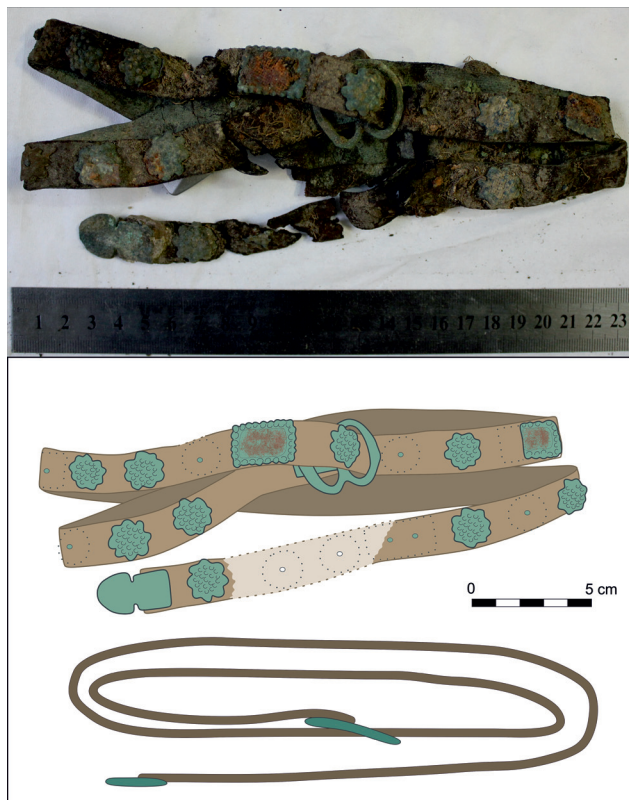
10. kép: A töredékekben felfedett ezüstveretes öv megközelítő rekonstrukcióját a néhol illeszthető szakadások és a veretek leosztása is segítette. (rekonstrukciós rajz: Füredi Ágnes)

deréktáján ezüstveretekkel díszített övre bukkantunk (10. kép). Az öv anyaga bőr, rajta vékony lemezből préselt ezüstveretek sorakoznak. A szíj eredeti hossza 90–100 cm között lehetett, szélessége kb. 2 cm. A veretek az öv teljes hosszán végigfutnak, kivéve a nyolcas alakú csat mögötti részt. Az öv túl hosszú lehetett a halottra: a derekat körbetekerték vele, a csaton áthúzták, majd a túl hosszú és eredetileg valószínűleg lelógatva viselt további szíjrészt még egyszer teljesen körbehajtották. Az öv belső felén néhol rákorrodálódott, finom, hézagos szövésű, gézszerű textilminta látszott, talán a halotti öltözet lenyomata. A hátoldalon megmaradt famaradványok a koporsóból származhatnak, míg a veretek felületén néhol látható textillenymat halotti lepelre vagy takaróra utal.