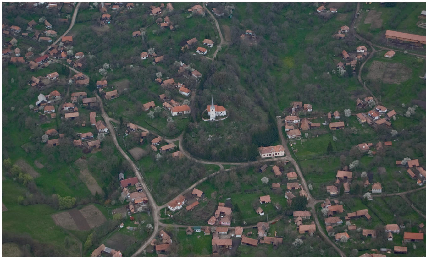
4. kép: Légi felvétel Énlakáról. A kép előterében az unitárius templom és a temető

táltak Drávaszög és Szlavónia több magyarlakta településének épületeit. 4 A felmérők nagyobb csoportját alkotó építészeket és hallgatókat a PTE PMMIK építész, építészmérnök képzése és a Breuer Marcell Doktori Iskola biztosította.