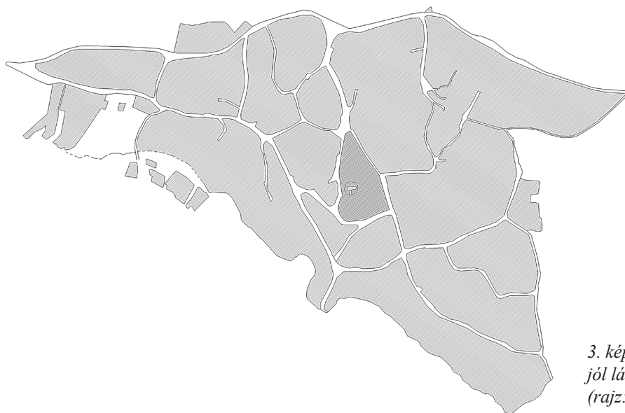
3. kép: Énlaka településszerkezete; jól látszanak az eredeti tízesek és azok aprózódása (rajz: Zsiga Zoltán)

limesének kutatása 1 öt székelyföldi múzeum 2 és a Pécsi Légitrégészeti Teka együttműködésében, önálló program keretében folyik. 3 A komplex értékméntési projekt célja tehát a kezdetektől több volt, mint egy régészeti, építészeti dokumentáció készítése. Nem metszetet vagy állóképet szerettünk volna készíteni egy aktuális állapotról, hanem reális jövőképet és az identitás megőrzését biztosító tervet kívántunk kínálni a település számára.