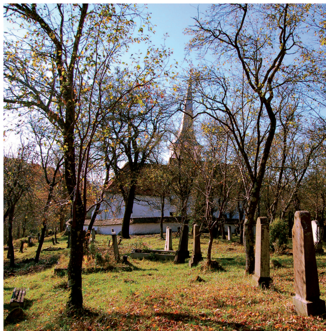
1. kép: Az énlaki temető

A bemutatás alapján talán már érzékelhető, hogy az énlaki értékmentési folyamat miért különbözik egy hagyományos régészeti, néprajzi vagy építészeti feladattól. Olyan komplex felmérésre törekszünk, amely mindezen értékek együttes vizsgálatát jelenti, és feltárja összefüggéseiket. Dacia keleti