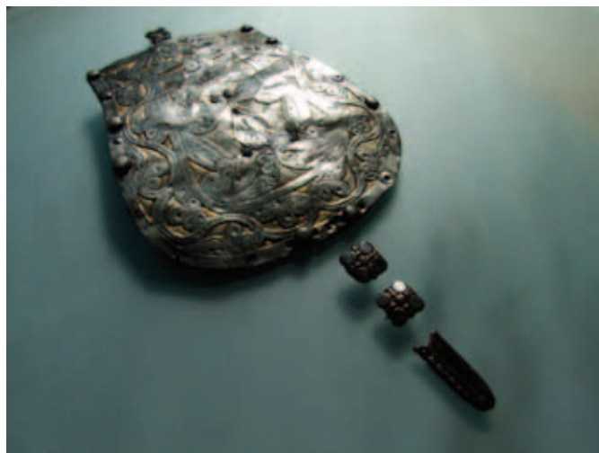
A tarsolylemez valamint függesztőszíjának veretei és szíjvége

Az újabb kutatások leletei és a korábbi megyei emlékek tavasztól megtekinthetők a Pest Megyei Múzeumok Igazgatóságának vándorkiállításán („Nem múlt el nyomtalanul” – Honfoglalás kori leletek Pest megyéből). Időpontok és helyszínek: Cegléd, Kossuth Múzeum, 2012. március 30. – április 29., Vác, Görög Templom Kiállítóhely, 2012. május 11. – július 15., Visegrád, 2012. ősze.