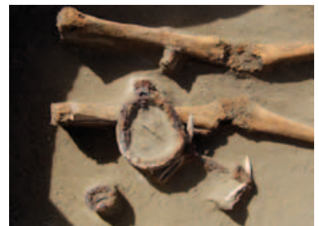
A lószerszámot az oldalpálcás zablával ebben az esetben a halott lábai fölé helyezték el