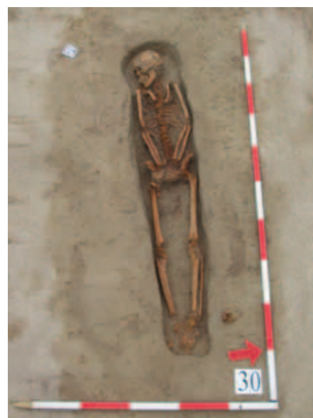
A tervásatás során feltárt egyik rönkkoporsós sír