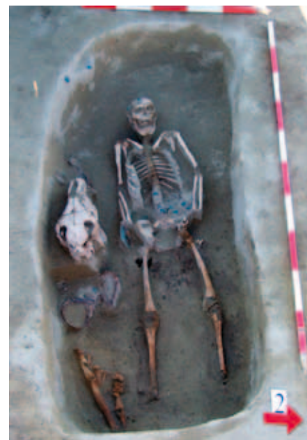
A tarsolylemezes sír; veretes övvel, lócsontokkal, lószerszámval. A hasi rész jobb oldalán állatjárat bolygatta az övvereteket

Az ásatás friss eredményei még kiértékelésre várnak, de az már most is egyértelmű, hogy a 10. század második felében, végén használták a temetőt, s a közösség egyik rangos vezetőjének sírjában találtuk meg