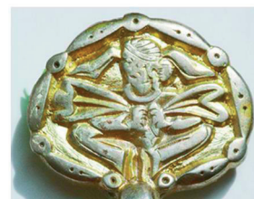
2. kép: Csat és övveretek a Szubotcy lelőhelyről (Ua)